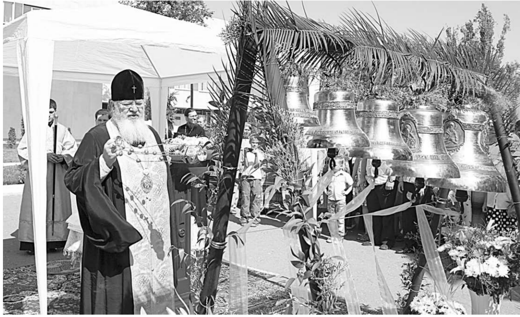
Сделан ещё один важный шаг в создании храма.