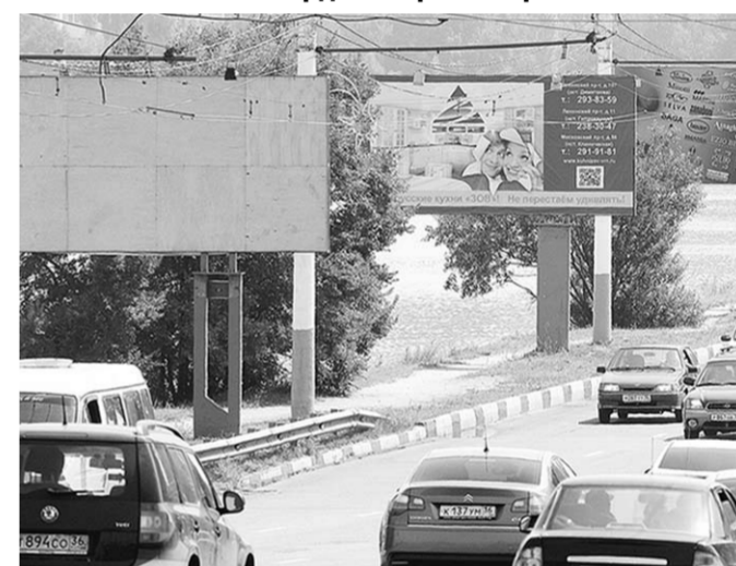
Этот щит уже опустел. Может, его площадь пойдёт на благое дело – на социальную рекламу защиты здоровья детей, например.

Рекламные щиты, на которых вместо рекламы – поздравления или политическая пропаганда, в Воронеже не редкость. А ведь их хозяева наверняка догадываются о том, что подобным образом использовать билборды неправомерно.