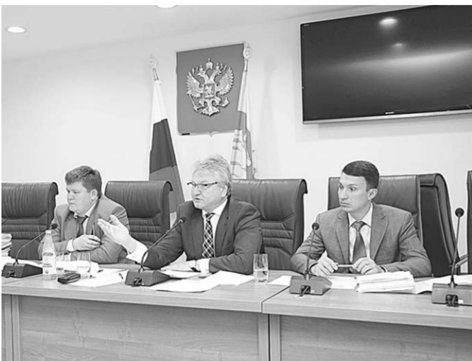
Во время заседания.

Вчера на 52-м заседании Воронежской городской думы, последнем перед летними каникулами, депутаты рассмотрели более 30 вопросов.