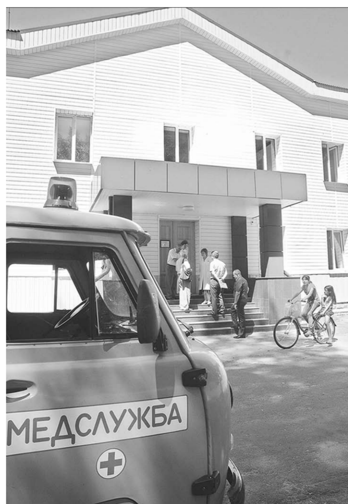
Машина «скорой помощи» всегда дежурит у подъезда врачебной амбулатории в Хреновом.

Здравоохранение | По качеству и оперативности медицинская помощь жителям глубинки не должна отличаться от городской