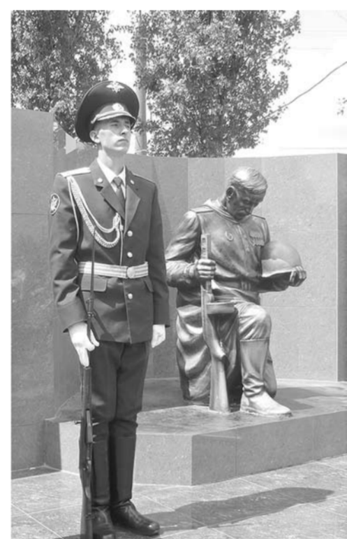
У мемориала защитникам Отечества.

Образование | В Воронежском институте ФСИН России произошло сразу три знаменательных события