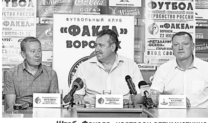
Штаб «Факела» настроен оптимистично.

А мы от себя добавим: «Факел» – в добрый путь!