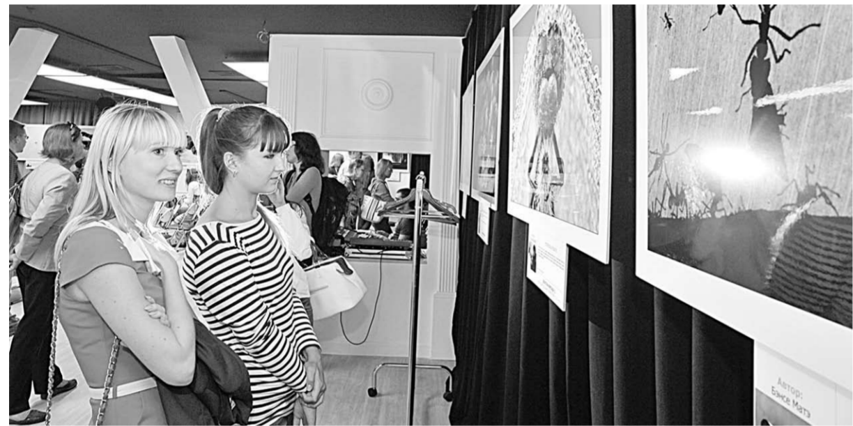
Открытие выставки – всегда праздник.

Выставка | В Воронеже впервые открыта фотовыставка работ, которую организовал один из самых престижных в фотографическом мире журнал National Geographic