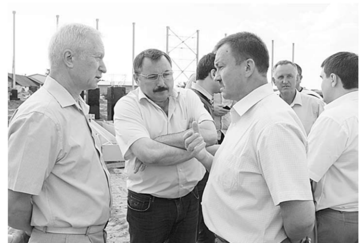
По программе «Газпром – детям» в Бутурлиновке строится физкультурно-оздоровительный комплекс.