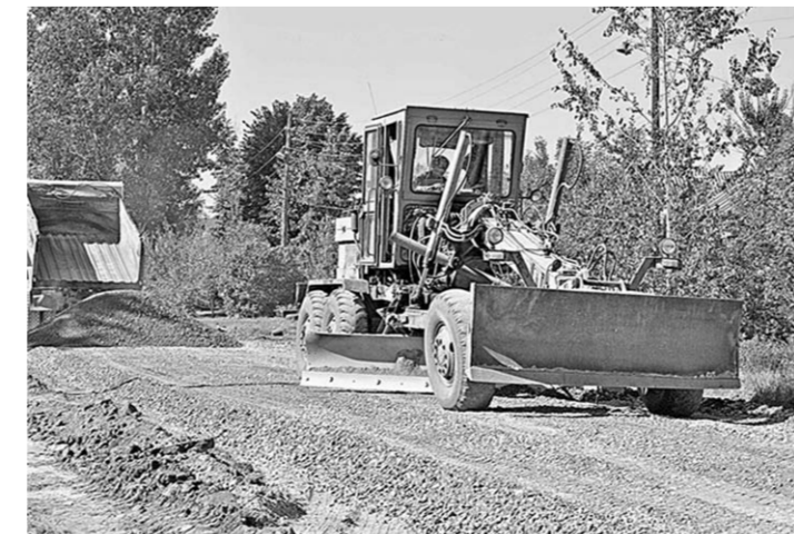
Ремонт автодорог и строительство новых в бутурлиновских поселениях теперь не исключение, а правило.

В августе уже съём новый ДК в эксплуатацию. Домом-то культуры его язык не повернётся назвать – настоящий сельский дворец на 200 мест. Но это же только один, просто достаточно известный пример нынешней политики области в отношении развития сельских территорий. Скажем, губернатор нас поддержал, и в программу «Газпром – детям» было включено строительство в Бутурлиновке спортивного комплекса с двумя плавательными бассейнами – для детей и для взрослых, с игровым залом на тысячу зрительских