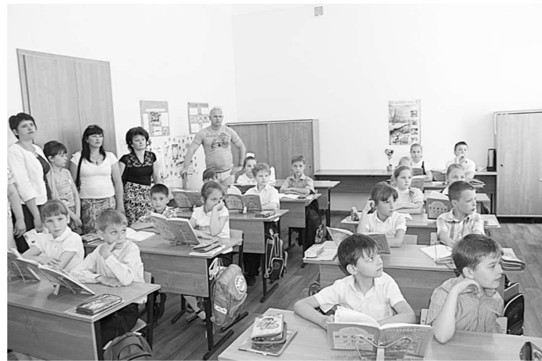
Когда глаза детей светятся радостью – рады и взрослые. В Бутурлиновской средней школе №1.

Беседу вела Алексей СОЛОВЬЁВ, Алексей ЧЕРТОВ.