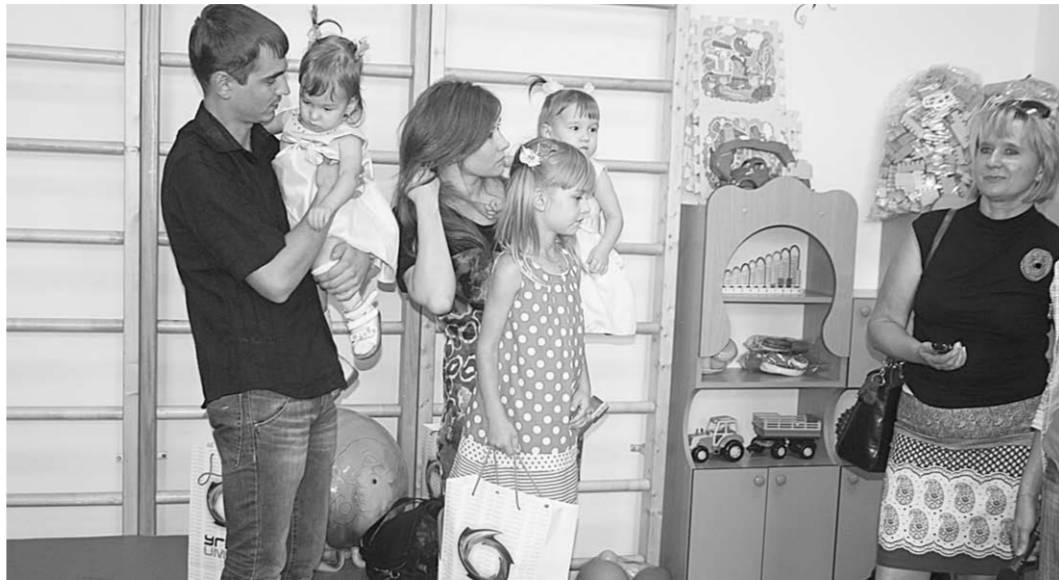
Полезное занятие по душе в новой игровой комнате найдётся детям всех возрастов.

Но на этом подарки от фонда «Дети России» не закончились.