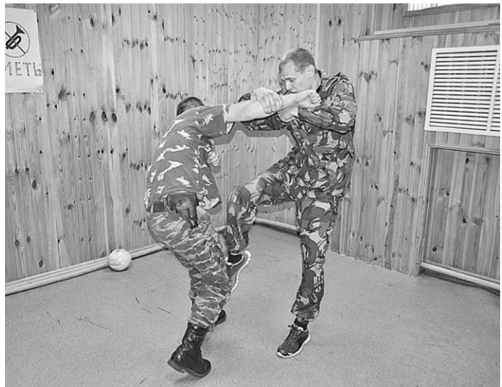
От теории - к практике.

Конкурс | В Воронеже бойцы спецподразделений транспортной полиции выясняли, кто из них лучший