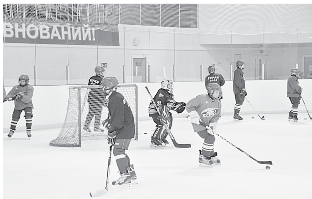
Воронежский хоккейный клуб «Буря» проводит сборы на базе Ледового дворца.