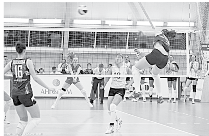
С азартом играет женская волейбольная команда «Воронеж».

Так в теории, а на практике это привело к созданию прочного коллектива в составе че-