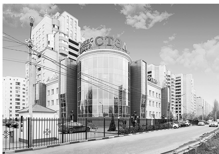
Офис компании – одно из красивейших зданий Воронежа.