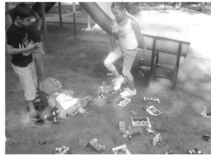
Дети учились выбирать между добрым и злым «контентом».