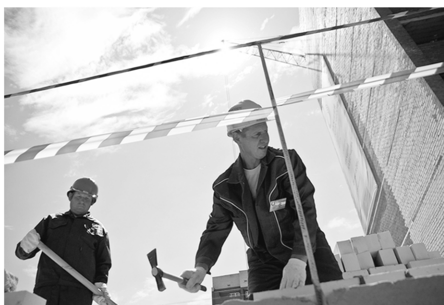
В компании трудятся только квалифицированные специалисты.