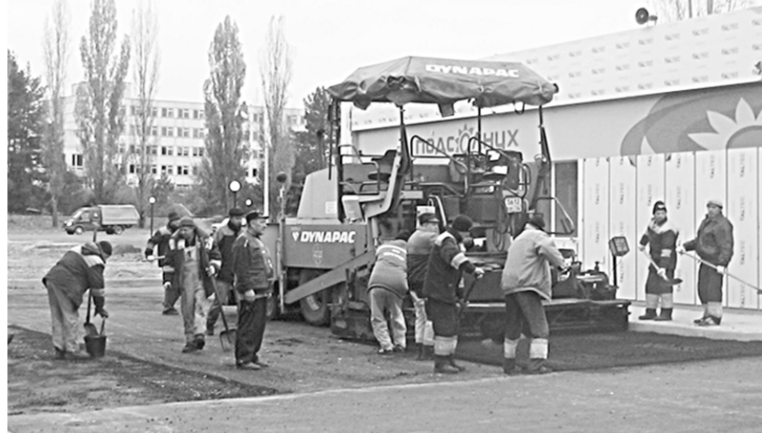
Работы по благоустройству заправочного комплекса ведёт ООО ГК «ГОЧЕЛ».

Заканчиваем работы по так называемой «Фукусимской» теме, – продолжает генеральный директор. – После аварии на АЭС «Фукусима-1» ядерной безопасности атомных станций уделя-