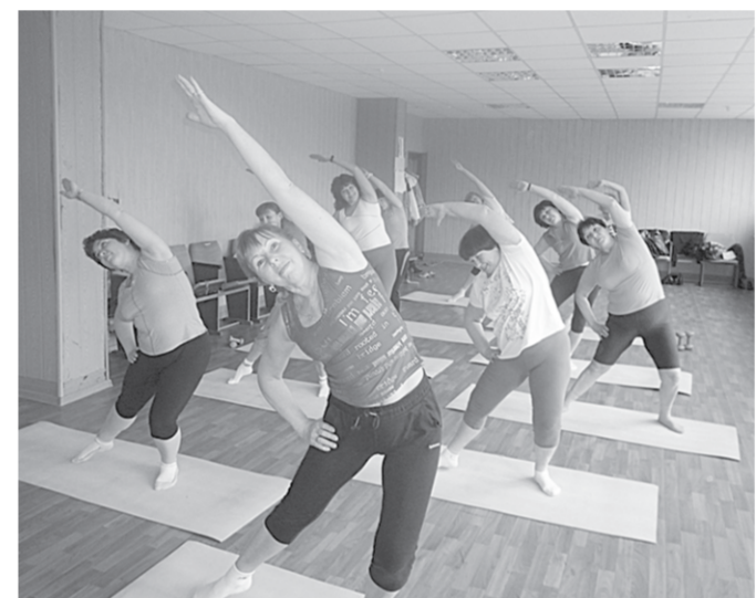
Сотрудницы мехзавода занимаются аэробикой.