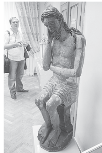
Деревянная скульптура «Христос скорбящий» (XVIII век).