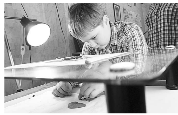
За работой над мультиком.