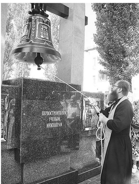
По всей округе разнеслась благая весть.

Архитектурный конкурс на проект памятника городские власти объявили ещё весной. Свои работы представили как маститые воронежские скульпторы, так и молодые таланты. Всего на конкурс было выставлено шесть работ. Среди предложенных были интересные проекты, ярко передающие эпоху грандиозной стройки конца 50-х — начала 60-х годов.