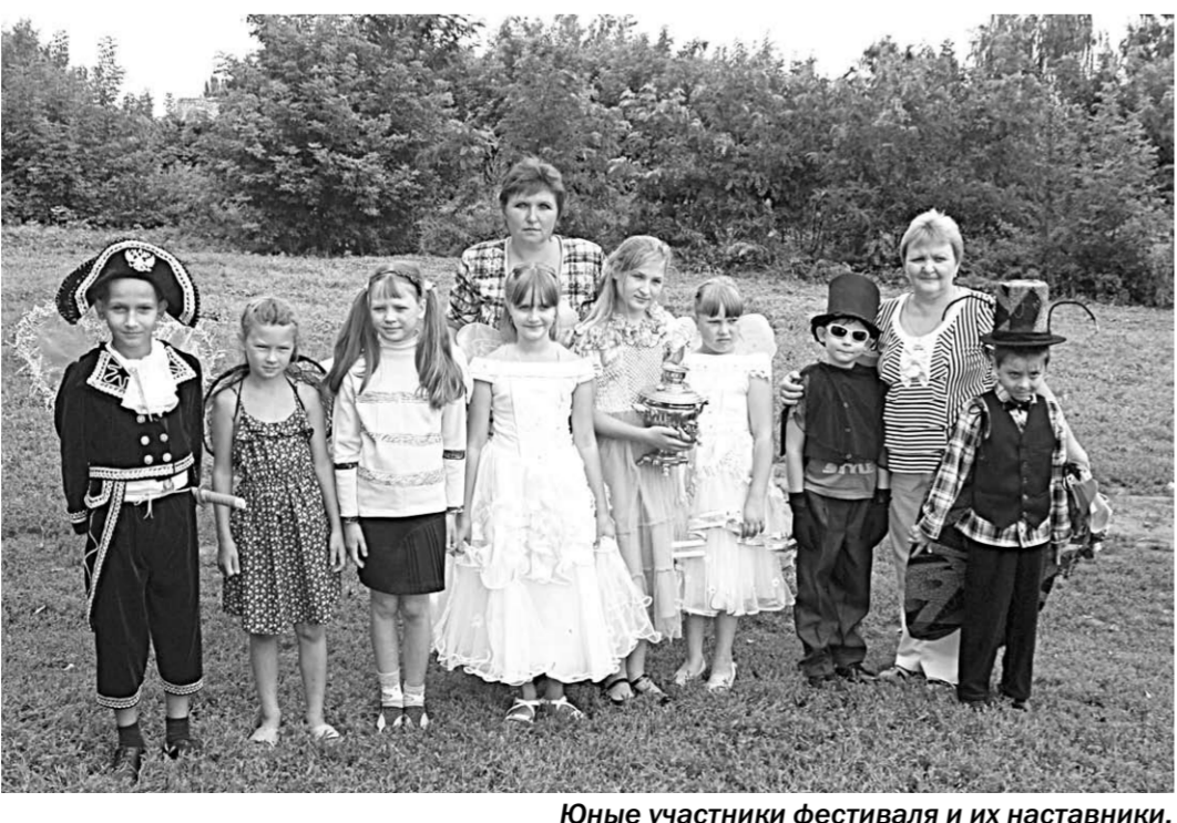
Юные участники фестиваля и их наставники.

Фотография храма не сохранилась. Ее ищут юные историки и имеют намерение создать макет храма. Здание школы построено на его месте. О нём остались только людская память. И вот, как в покая-