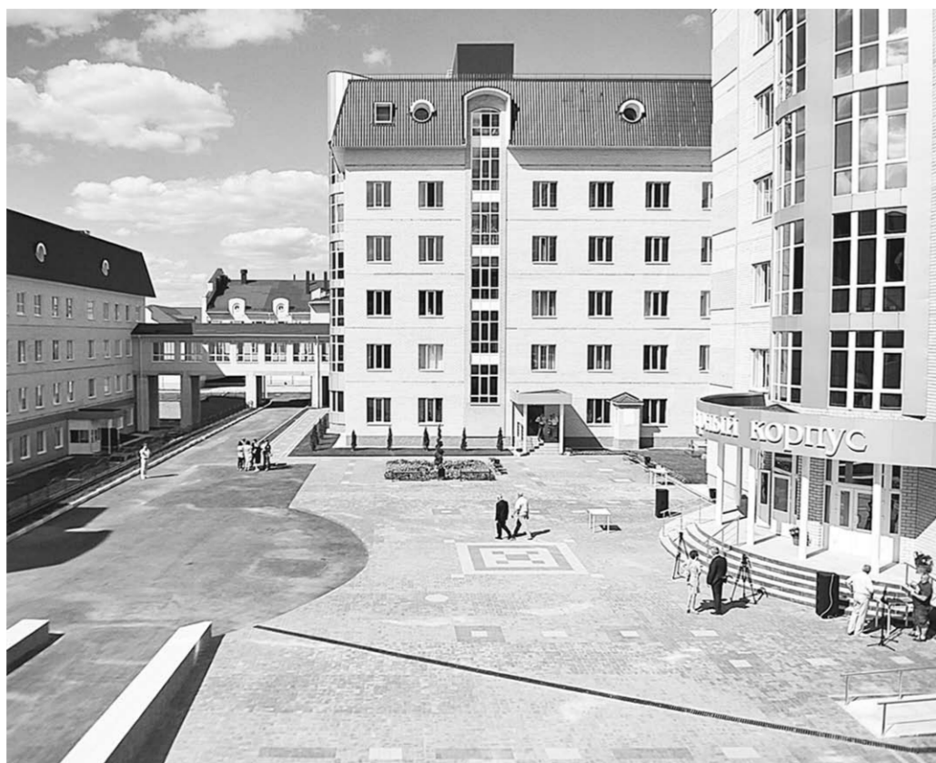
В Лисках завершён очередной этап строительства современного больничного комплекса.

В минувшую среду в Лисках собрались представители исполнительной и законодательной власти, главы районов Воронежской области. До начала заседания правительства все они приняли участие в открытии очередного лечебного корпуса на территории ЦРБ, которая строится в Лисках с августа 2006 года. Общая стоимость строительства составила более двух миллиардов рублей.