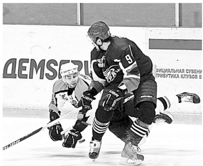
И на льду бывает жарко.

Очередным предсезонным турниром, в котором примут участие воронежцы, станет «Кубок Дизеля-2013». Спор за главный трофей соревнований поведут четыре клуба, представляющие ВХЛ: «Буран», «Дизель» (Пенза), «Динамо» (Балашиха) и ХК «Саров». Сроки проведения турнира: с 22 по 25 августа. А завершат предсезонную подготовку наши хоккеисты турниром в Воронеже, который пройдёт с 1 по 3 сентября. Соперниками «Бурана» на льду Дворца спорта «Юбилейный» станут ХК «Липецк», ТХК (Тверь) и «Кристалл» (Саратов).