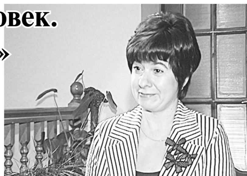
Отказавшись от избирательных средств, избравшегося фильмом кандидатом на должность мэра, Александр Гусев отбывает город Воронеж. Валентина Гусева. Александра Вятровича.

Хотите узнать правду о служебном романе кандидата в мэры Александра ГУСЕВА? Смотрите фильм «Город и его человек. Александр Гусев». На канале «ТНТ-Губерния» – 25 августа и 1 сентября в 19.45, 4 сентября в 19.30. Специальный показ на телеканале «Россия-1» во время программы «Вести недели», 25 августа в 10.20.