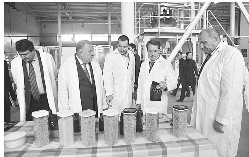
Алексей Гордеев с интересом ознакомился с продукцией макаронной фабрики.