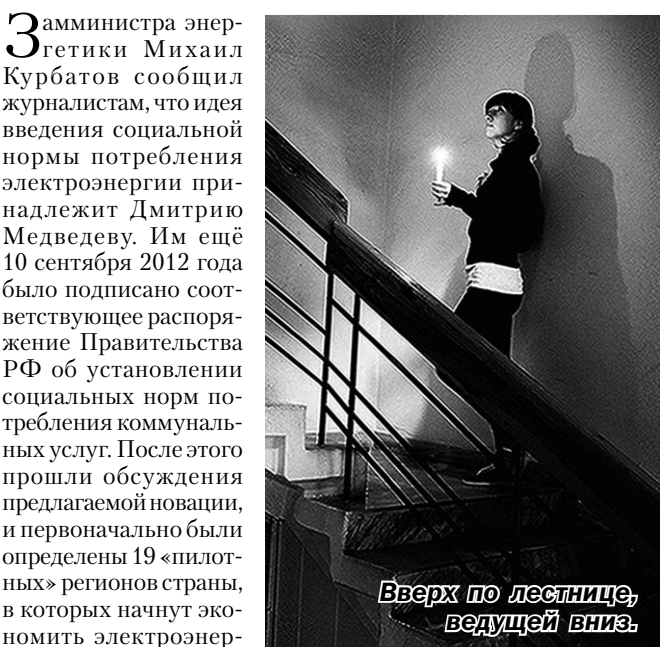
Вверх по лестнице, ведущей вниз.