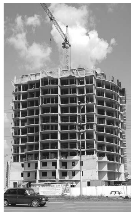
Ещё в конце 2009 года сюда должны были въехать жильцы.

Руководитель управления делами Воронежской области Виталий Шабалатов добавил, что важной задачей сегодня является завершение строительства проблемных объектов в установленные сроки. Он также отметил, что по каждому такому объекту принимались индивидуальные конкретные меры. Виталий Шабалатов сообщил, что до конца 2014 года проблему обманутых дольщиков на территории Воронежской области планируется полностью решить.