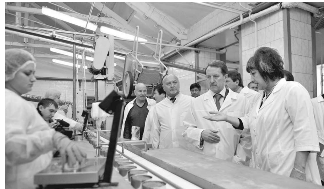
Алексей Гордеев побывал в одном из цехов Борисоглебского мясоконсервного предприятия.

лизации опыт других городов региона, – сказал губернатор. Отметив определенную динамику в социально-экономическом развитии муниципалитета, Алексей Гордеев задал вопрос о состоянии местных властей на имеющихся проблемах: качество дорог: одной из самых больших в Воронежской области очередей в детские дошкольные учреждения, а следовательно необходимости скорейшего строительства детского сада. Губернатор заверил, что в самое ближайшее время состоится разговор с министром Правительства РФ о выполнении федеральным центром обязательств по соблюдению сроков строительства моста через реку Ворона. Несмотря на то, что данный вопрос не относится к компетенции региональных властей, Алексей Гордеев намерен провести соответствующее совещание в облправительстве и взять решение проблемы под личный контроль. Подводя итог, глава региона сообщил, что по результатам рабочей поездки будет составлен протокол соответствующих поручений, проверка исполнения которых намечена на декабрь.