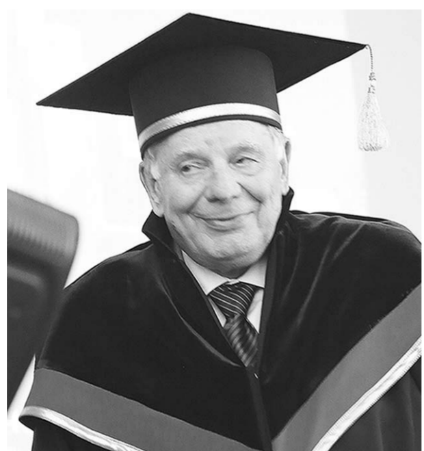
Теперь в ВГУ свой Нобелевский лауреат – Жорес Алфёров.

Событие | Вчера в Воронеже в актовом зале главного учебного корпуса ВГУ состоялось торжественное вручение диплома и мантии почётного доктора университета лауреату Нобелевской премии по физике, академику РАН Жоресу Алфёрову