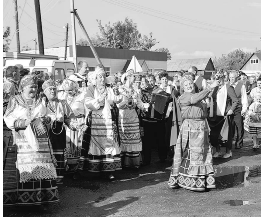
Не перевелись частушки на селе.