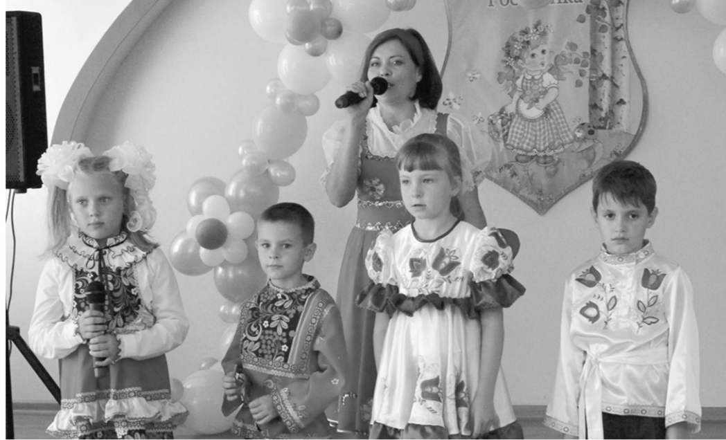
Не только строители, но и дети готовились к этому празднику.

ПРИЁМ ВЕДУТ КВАЛИФИЦИРОВАННЫЕ СПЕЦИАЛИСТЫ, КОТОРЫЕ ПРЕДУПРЕДЯТ О ВОЗМОЖНЫХ ПРОТИВОПОКАЗАНИЯХ