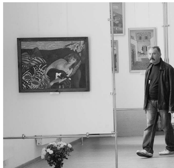
Кошка – один из главных персонажей картин художницы.

Будьте бдительны, когда снимаете деньги в банкоматах или пользуетесь платёжными терминалами. Записанный на листочек или набравший в открытую пин-код можно легко подсмотреть. Обратите внимание, нет ли какого-либо постороннего предмета на световой панели аппарата, на клавиатуре или даже на приёмнике карт (это может быть микроскопическая видеокамера, пластиковая накладка или специально считывающее код приспособление). Если есть малейшее подозрение, лучше воспользуйтесь другим банкоматом или платёжным терминалом.