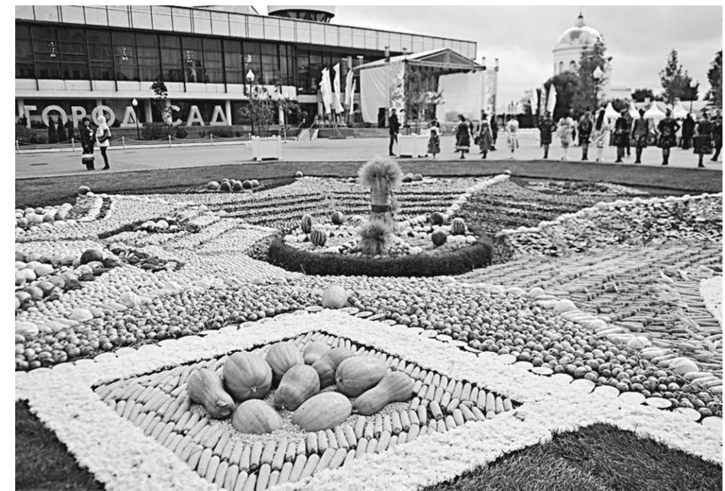
Плодово-овощной ковер покрыл центр Советской площади.

Изначально выставка-ярмарка «Воронеж – город-сад» была создана для развития современных направлений ландшафтного искусства, а также для воспитания горожан и повышения эстетического уровня города. Но с каждым годом она превращается в площадку для современного искусства, даёт воронежцам уникальную возможность оценить профессионализм людей, создающих рукотворную красоту и преобразующих окружающий мир.