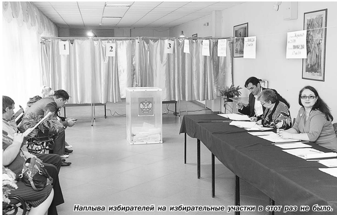
Наплыва избирателей на избирательные участки в этот раз не было.