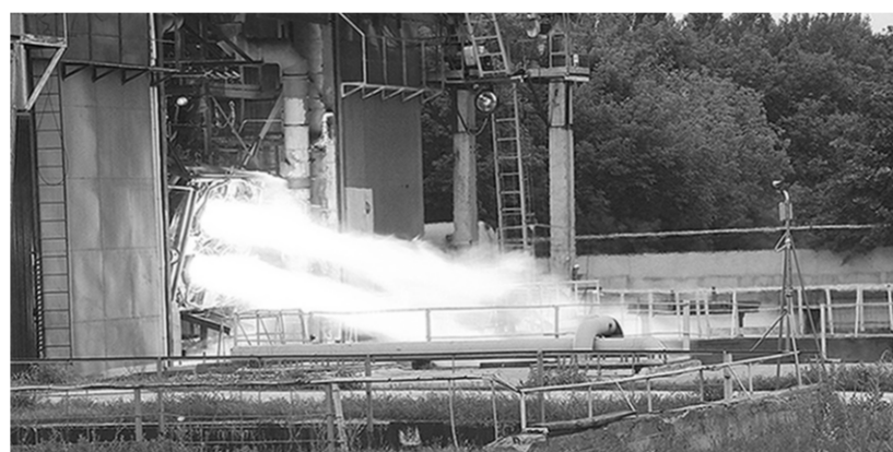
Огневое испытание ракетного двигателя РД0124А.

С 16 июля по 27 августа всего было проведено три огневых испытания данного двигателя по программе МВИ. Отработав без замечаний на стенде положенное время, двигатель