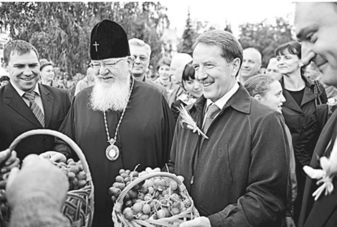
Участников и гостей праздника приветствовали губернатор Алексей Гордеев и митрополит Сергей.

Всех без исключения потрес гомадный самовар на 200 чашек, травяной роаль с настоящими клавишами, роскошное платье из овощей, в котором фотографировались все желающие посетительницы выставки, ароматные варенья из шишек и грецких