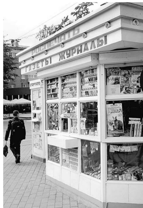
Киосков прессы в Воронеже не хватает. И в этом проблема.

Помимо финансовой стороны дела, коснулись на совещании и такого вопроса, как падение интереса к чтению у подрастающего поколения. С этим в Липецкой области тоже нашли, как справиться. Для детей придумали специальные окна и выкладку печатной продукции, расположенные на уровне их роста. Это, надо сказать, весьма эффективный