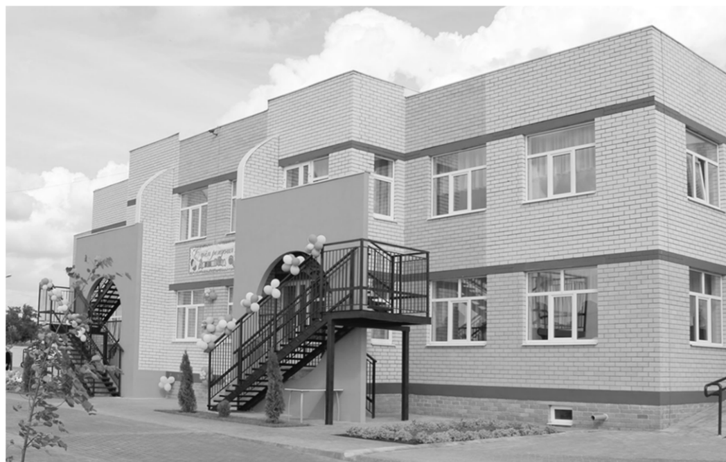
Новое здание детского сада украсило село.

Пусть всем в нём будет уютно, комфортно и интересно!