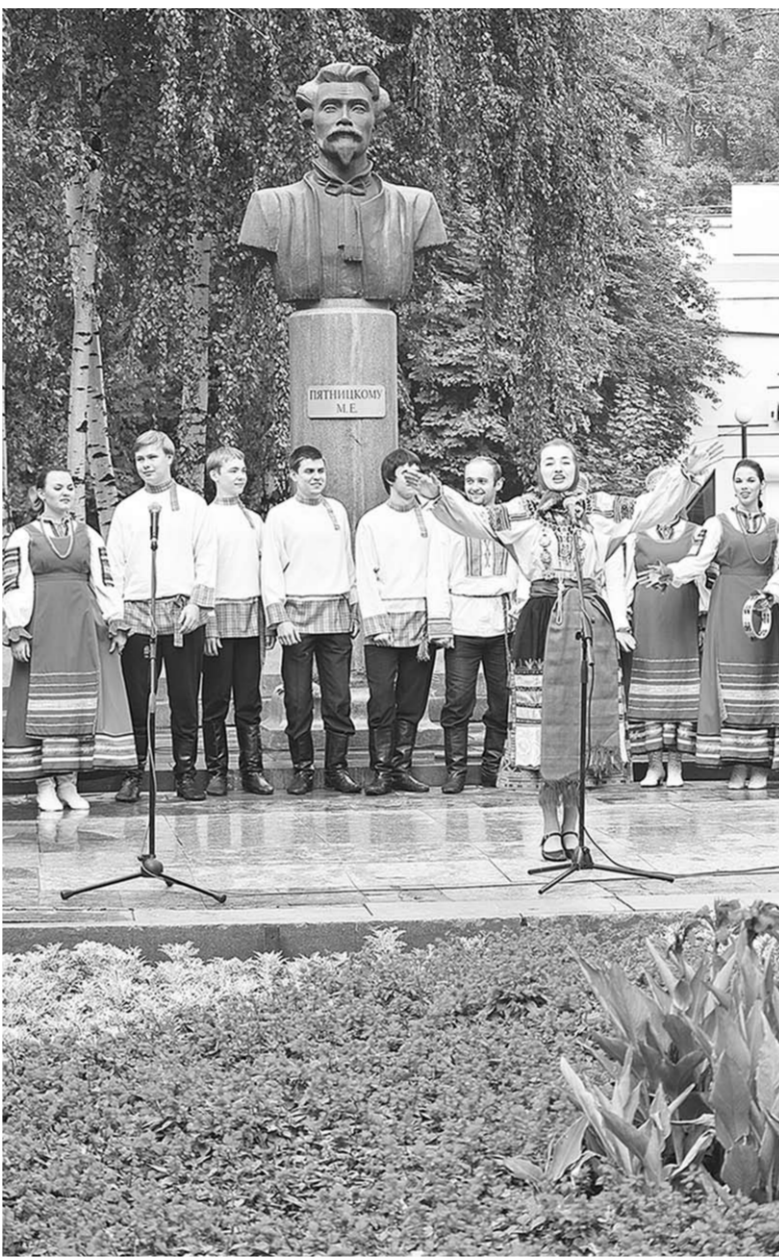
В Воронежской области – богатое культурное наследие. Как его развивать и приумножать?