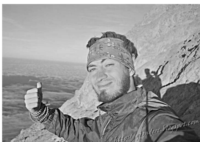
Ничто не предвещало беды.