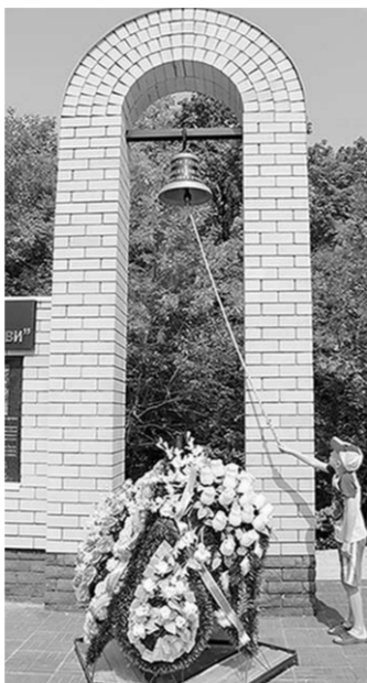
Мемориал «Дорога на крови».