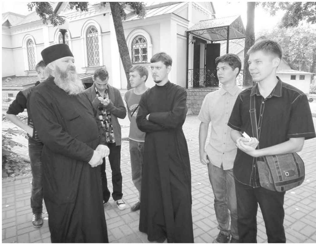
Очень интересной оказалась поездка в монастырь преподобного Серафима Саровского.

Ныне школьники и студенты занимались сбором старинных духовных стихов. С давних времен песня сопровождала человека всю жизнь