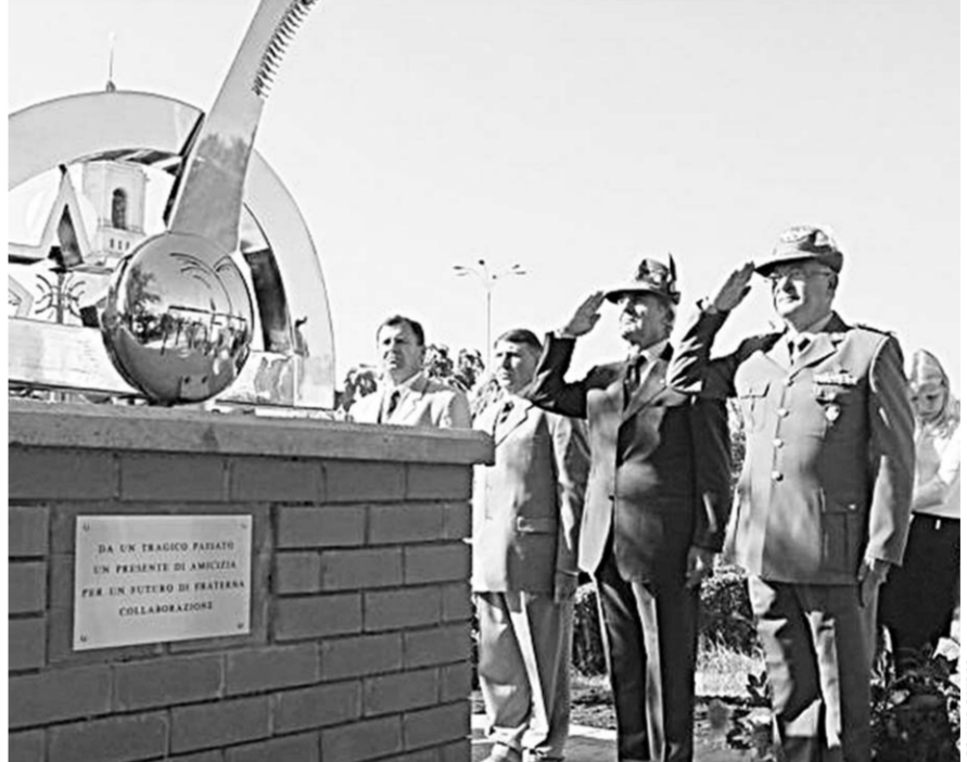
Тот самый памятник, к которому полагают цветы и отдают честь военные туристы из Италии.