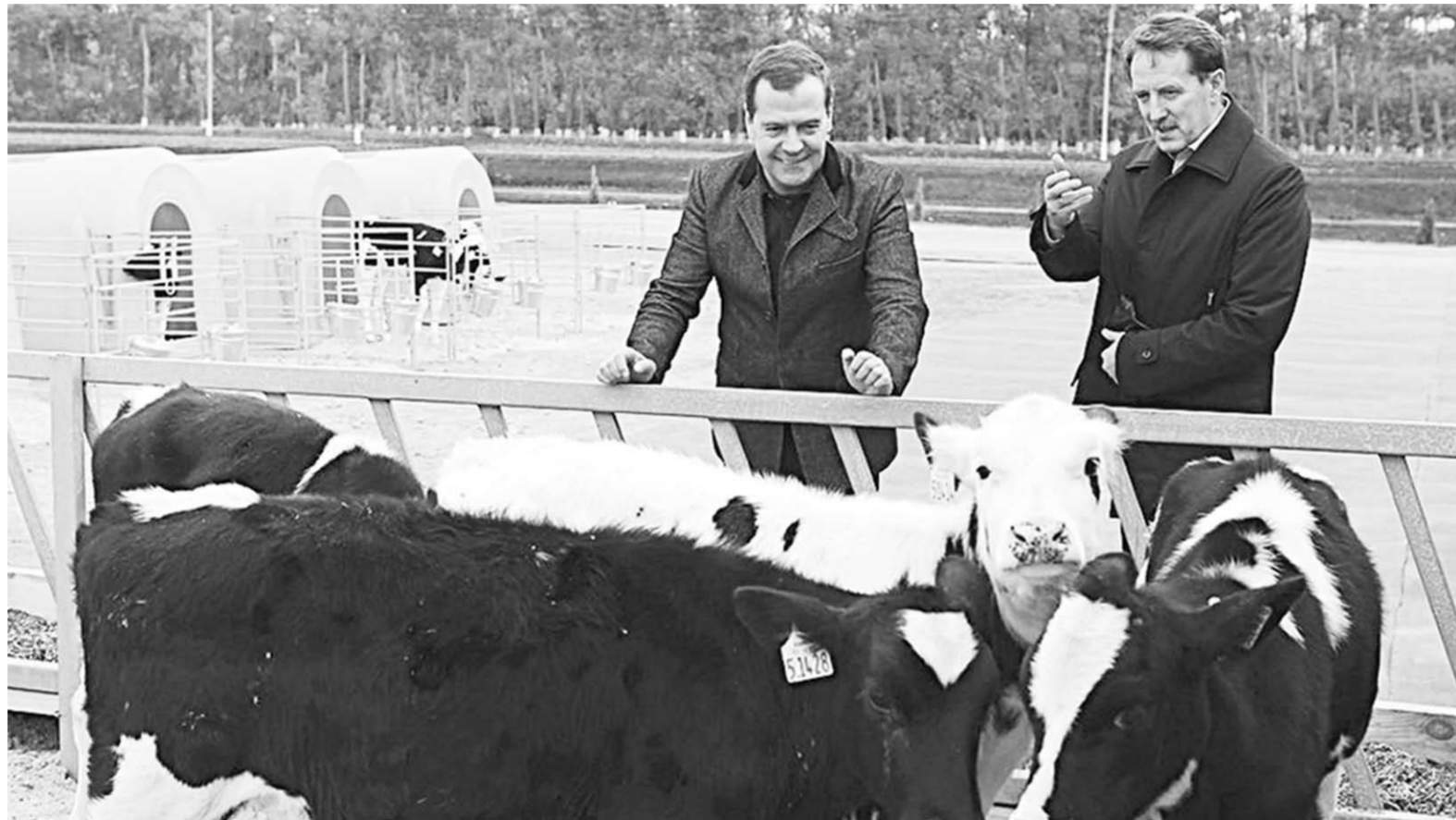
Дмитрий Медведев и Алексей Гордеев в лискинском хозяйстве «ЭкоНива-АПК Холдинг».

Визит | Председатель Правительства РФ Дмитрий Медведев провёл в Лискинском районе совещание по развитию молочного животноводства в стране