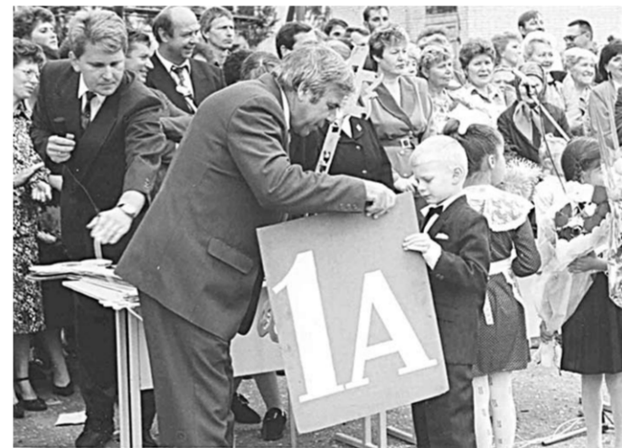
С добрым напутствием к первокласснику.

В армии же он постарался впитать всё то, что так щедро с самого детства предоставили ему семья и школа. Дважды