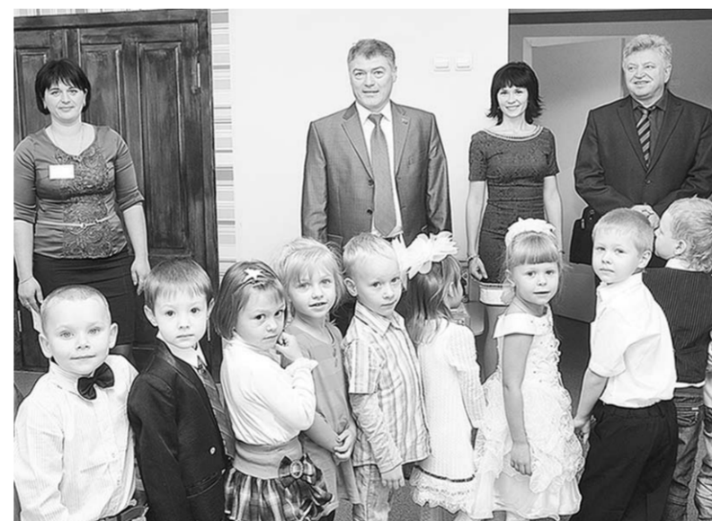
Первые гости и первые воспитанники детсада.

Всего групп здесь будет шесть. У каждой – своё имя. Группа раннего возраста называется «Неваляшки»;