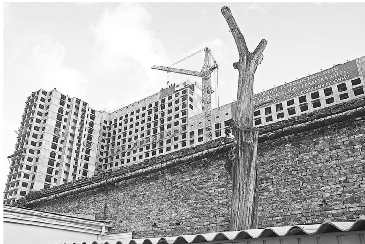
При точечной застройке - не до больниц и детсадов.