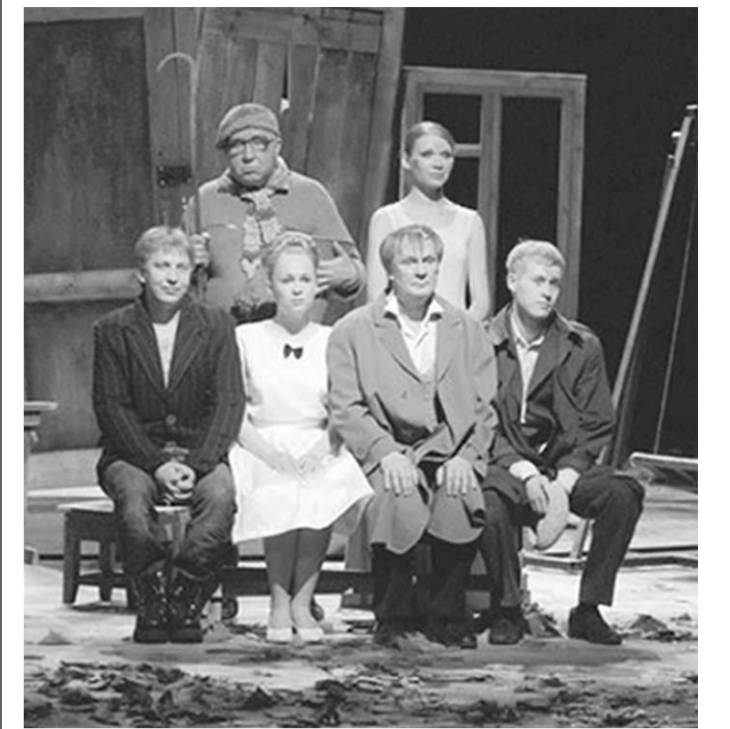
Сцена из спектакля «Предместье».