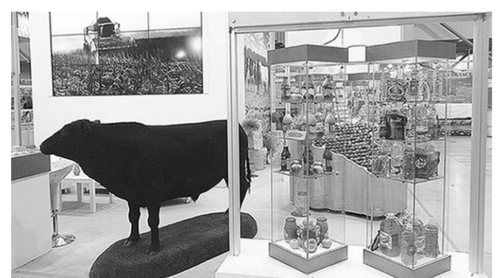
Витрина воронежских аграриев.