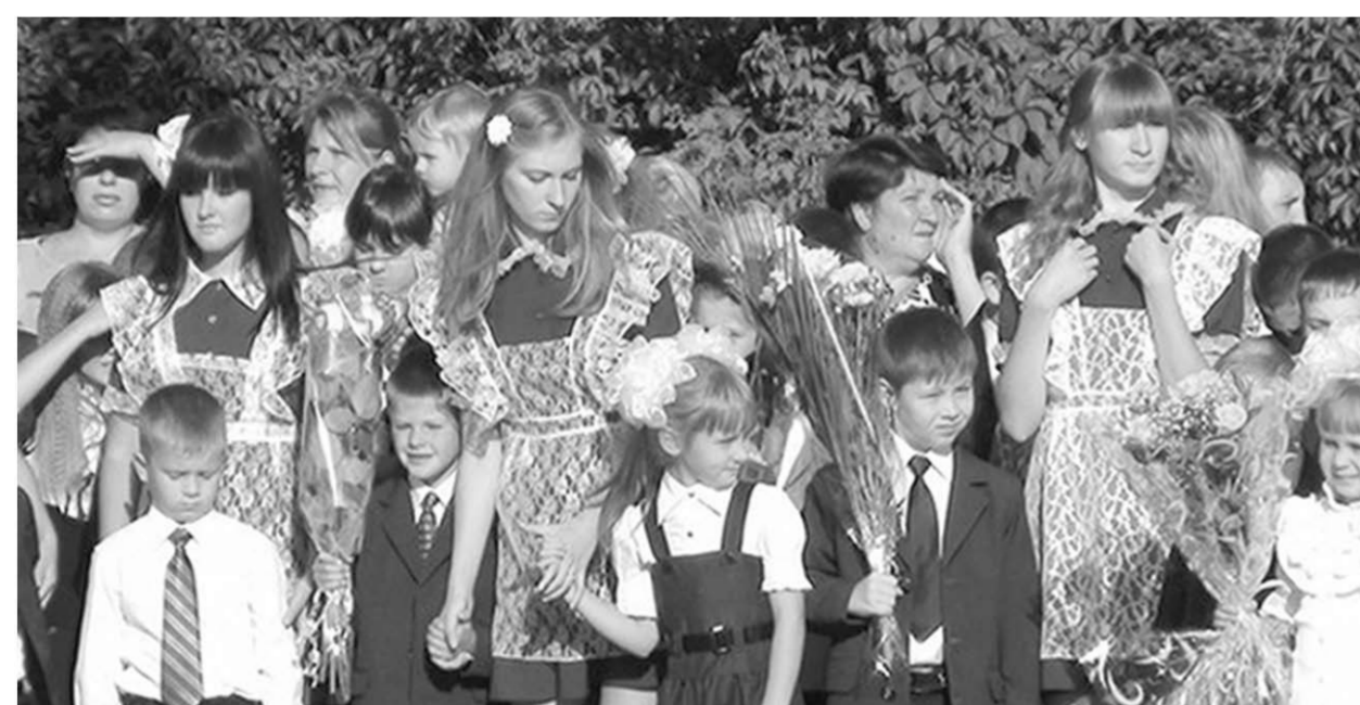
Старшеклассники и юные лицеисты.

И удаётся ли теперь персонажам спектакля вырваться общими усилиями?