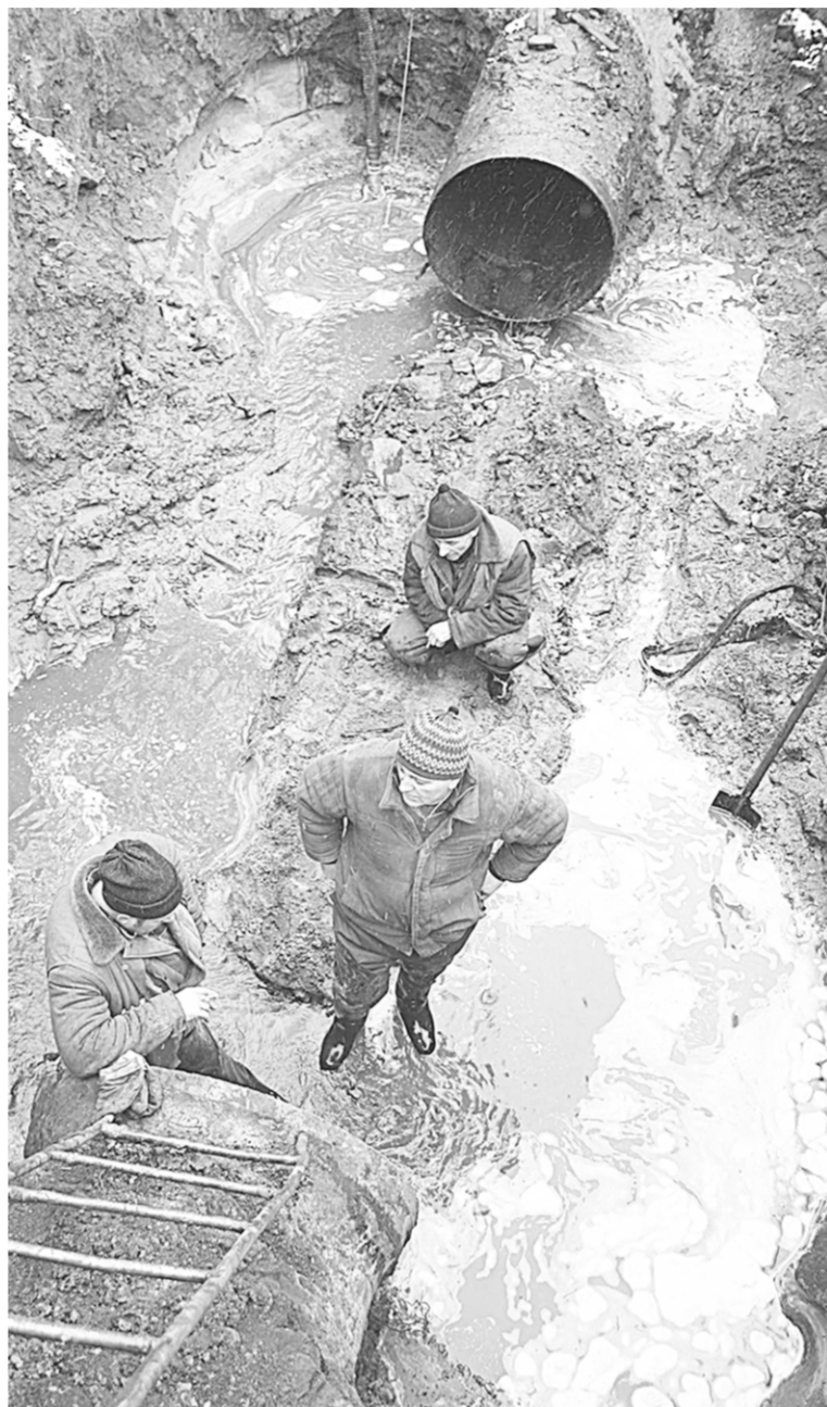
Советь – понятие относительное, когда речь идёт о больших деньгах.