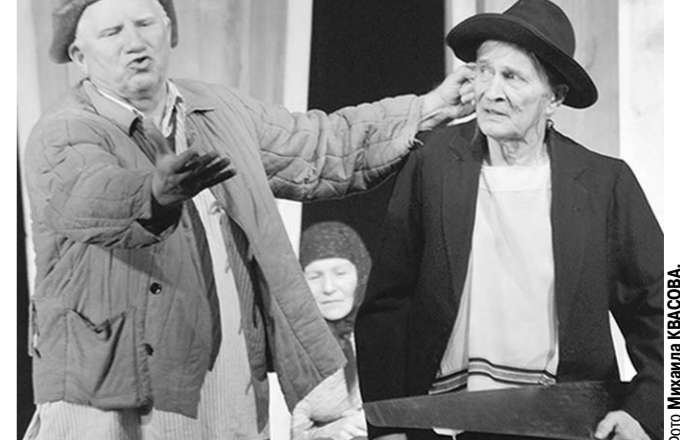
Сцена из спектакля «Скрипка Ротшильда».

Будет оно иметь форму скрипки или пилы – какая разница?