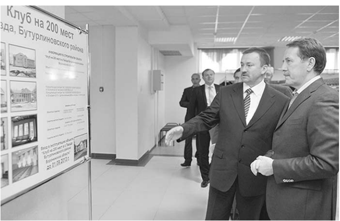
Губернатор знакомится с историей строительства СКЦ «Импульс».