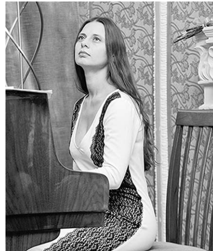
Композитор Наталья Горобец.