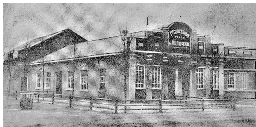
Первый совхозный театр (фото из журнала «Ленинский путь», 1934 год).

На сцену он впервые вышел в 1907 году – было ему тогда лет девятнадцать. До революции успел поработать на сценах Муром, Арамакса, Путивля, Глухова, Балашова, Вологды. Да и после поехал по стране: артисту андировали в Саратове и Архангельске, Туле и Баку, Архангельске и Коломне. В 1933 году оказался в Воронеже. Вспоминают, что его актерский диапазон был широк,