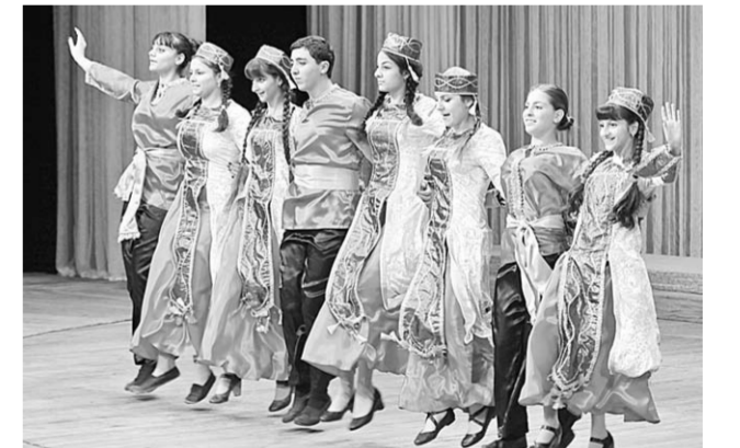
На сцене концертного зала танцевали представители разных национальностей.