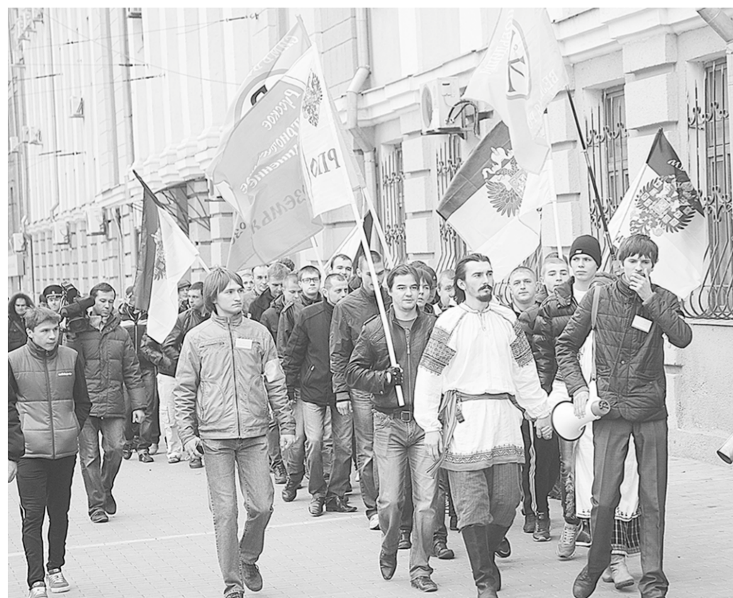
Участники национально-патриотического марша 4 ноября.

Прошли они буднично, без нарушения общественного порядка