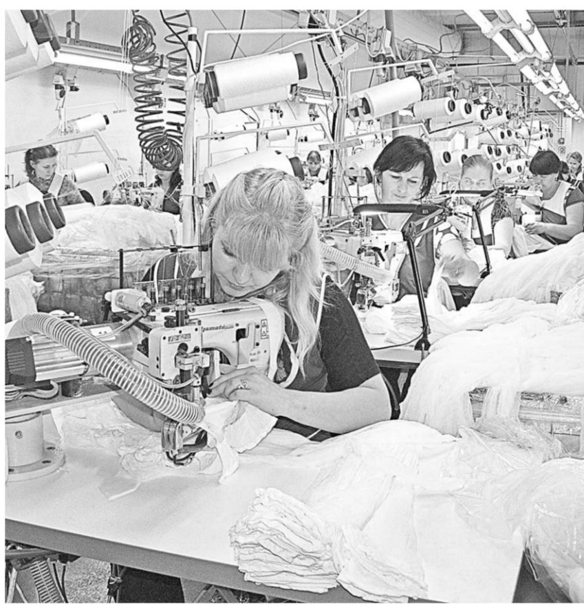
В швейном цехе ООО «Конте Спа».

Сегодня в «Конте Спа» трудится около двух с половиной тысяч человек, причём за вязальными и швейными машинами можно увидеть и молодых парней. Объемы выпускаемой продукции и её экспорта растут с каждым месяцем. А в пригороде Гродно «Конте Спа» возводит ещё одну фабрику – по производству изделий из полиамидных нитей. Она