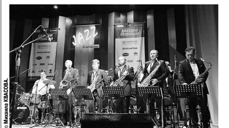
На сцене – оркестр Олега Лунгстрема.