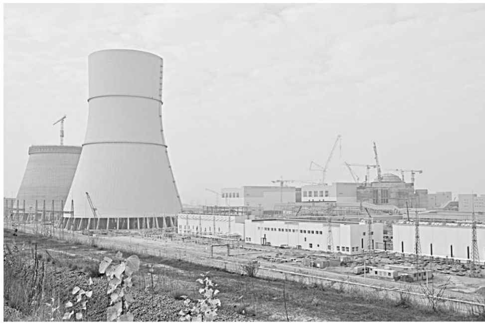
Вид, открывающийся со смотровой площадки, впечатляет масштабностью.