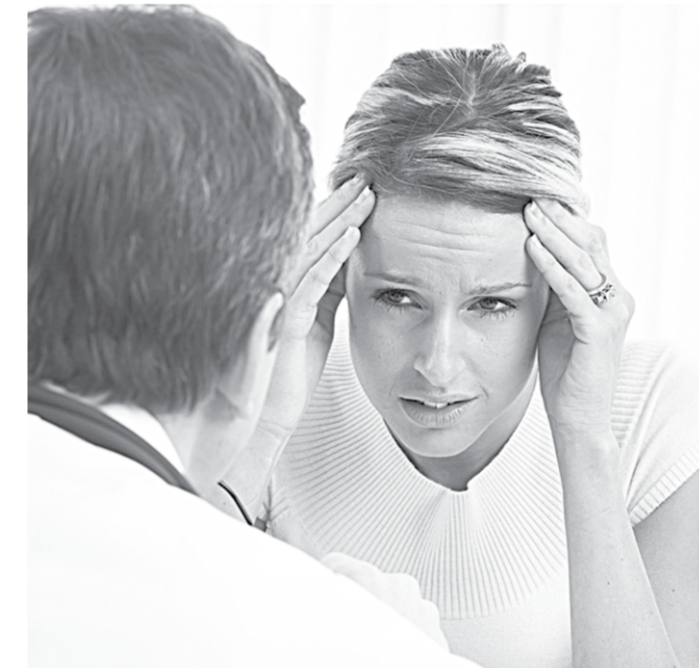
Боль – это сигнал о физическом неблагополучии.

Мы занимаемся лечением не только взрослых, но и детей практически с самого их рождения. У нас работают специалисты, имеющие под-