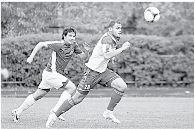
В атаке – «Выбор-Курбатово».

Отметим, что в этом сезоне «Выбор-Курбатово» просто «озолотился». Чемпионом МОА «Черноземье» стал основной состав этого клуба, а ещё две команды заняли первые места в таблице о рангах чемпионатов области и города. И лишь их старшие товарищи немного «подвели», завоевав в чемпионате Воронежской области среди ветеранов только «бронзу».