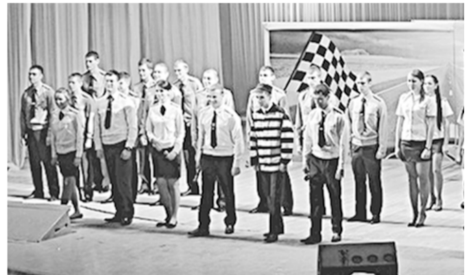
На сцене – «Приказ 390».

Команда Воронежского института ФСИН России стала вице-чемпионом Центральной лиги КВН «Старт».