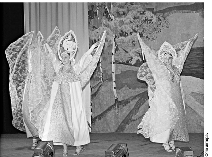
Творческие коллективы района дарят аграриям своё искусство.