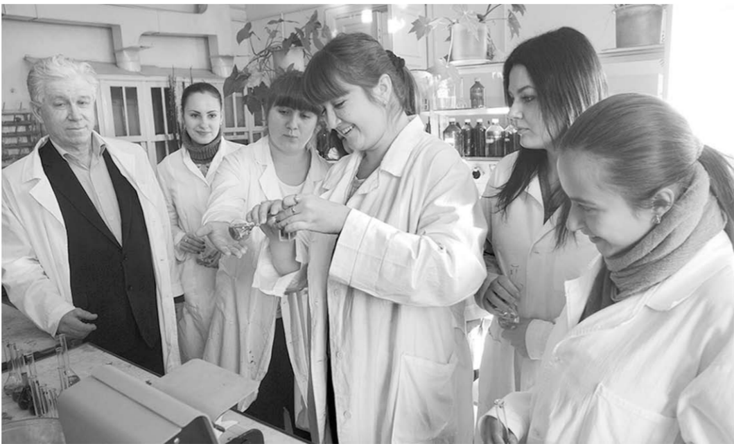
На занятиях в учебной лаборатории.