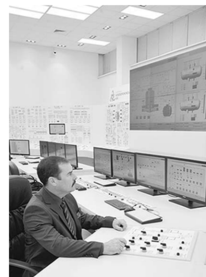
Тренажёр — точная копия пункта управления.