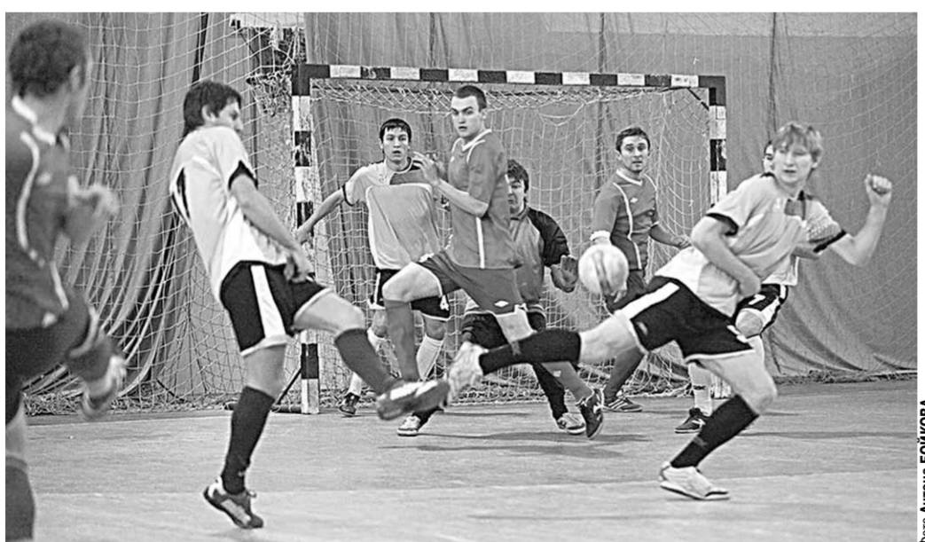
Футбол ушёл под крышу.

После стартовых туров турнирную таблицу в группе «А» возглавил «Воронеж-Энерго», а в группе «Б» — «МТС-Трактор», одержавшие победы во всех трёх проведённых играх. Леонид ХРУЩЁВ.