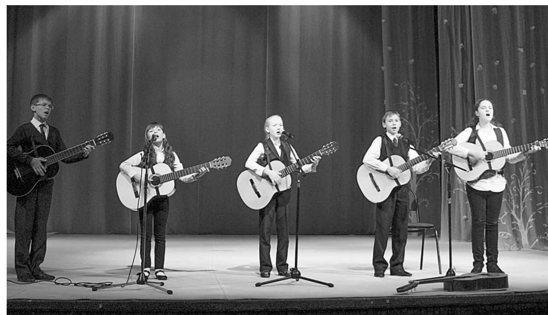
Песни в исполнении лауреатов детского бардовского фестиваля «Звёздочки Черноземья» понравились всем.

Общество | Собранные на благотворительном концерте средства пойдут на проведение ёлки для ребят из многодетных семей