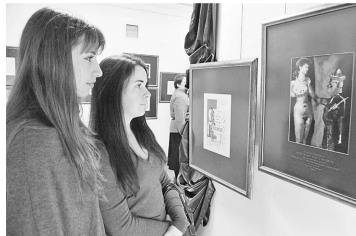
Первые зрители выставки «Искушение».

А вот он сидит и смотрит на нас: смешной и беззащитный, с хитрой и немного грустной улыбкой.