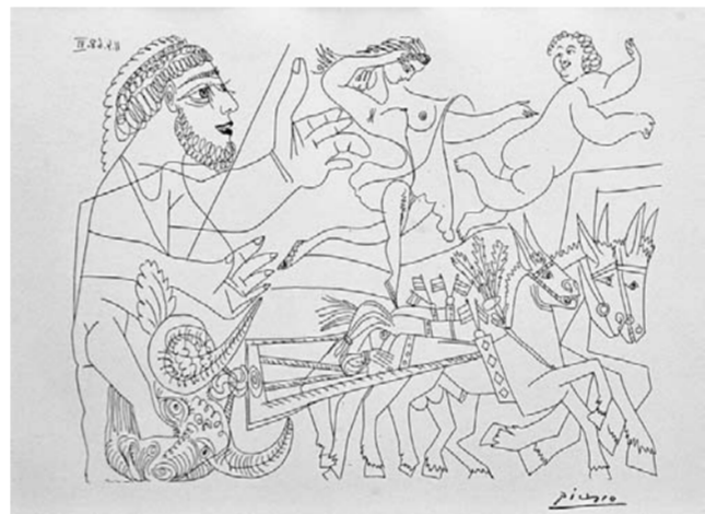
Одна из работ Пикассо.