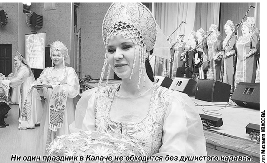
Ни один праздник в Калаче не обходится без душистого каравая.