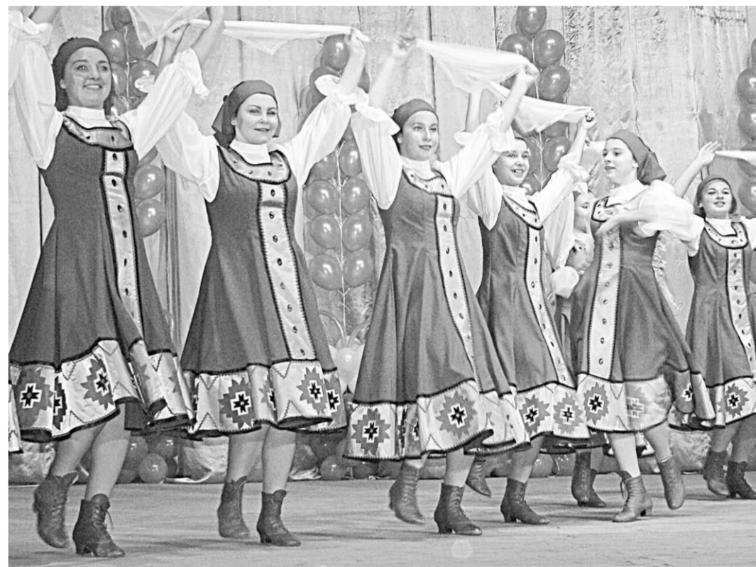
Поздравляет танцевальный ансамбль «Россияночка».