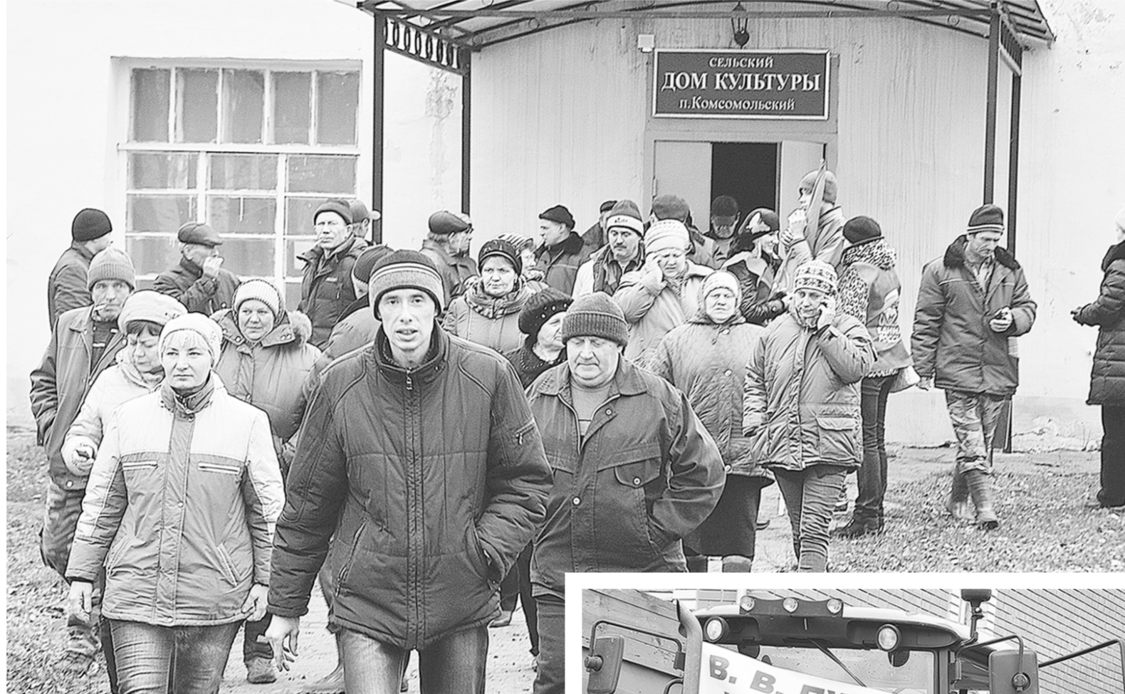
Тяжкие думы одолевают не только руководителей района и хозяйства «Агротех-Гарант Берёзовский», но и простых тружеников.