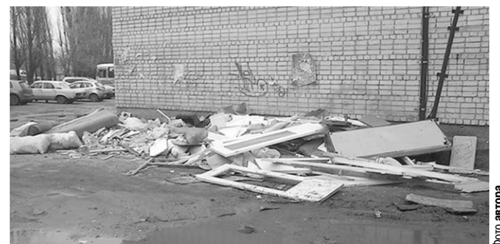
Такая картина не красит город.