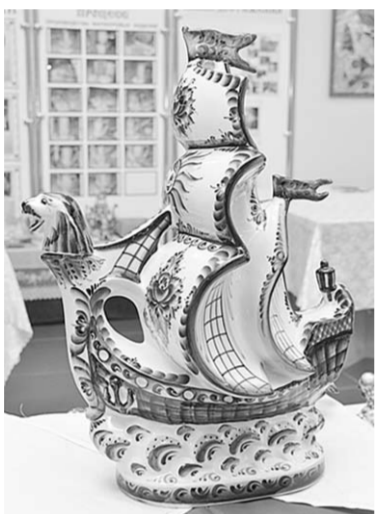
Бежит кораблик по волнам.