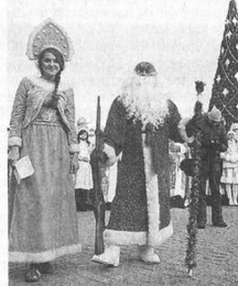
Праздновать будем не хуже, чем в прошлом году.

Показать себя предлагают и Дедам Морозам, которые вот уже пятый год подряд будут выступать на массовом ледяном парадом 21 декабря и состояться в нескольких номинациях. Приклеить бороду с усами и повесить за плечи мешок с подарками смогут все желающие «ледушки», к которым разрешение присоединиться и «внукам». Для этого нужно подать заявку по адресу: kultura_centrum@mail.ru .