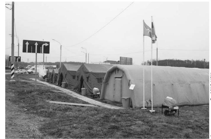
Развёрнут оперативный штаб МЧС.