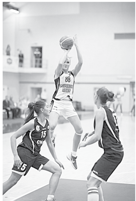
«Воронеж-СКИФ» в атаке!

Матчи 7-го тура баскетболистки «Согдианы-СКИФа-2» провели в Липецке. Но разжаться очками в городе сталеваров нашей команде не удалось. Оба матча воронежцы проиграли местной команде «Армастек» - 61:71 и 57:82.