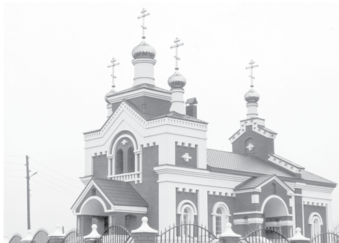
Труд на земле невозможен без духовной поддержки. Потому в селах и строятся храмы.

Немалое внимание уделяет он животноводству. В реконструированном коровнике оборудованы кормовые столы, установлены современные доильные оборудование с молокопроводом и танком-охладителем известной зарубежной фирмы. Приобрели и