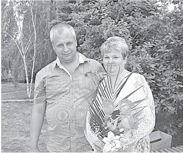
Вместе, как и двадцать пять лет назад.

На моей любимой фотографии изображена красивая блондинка в белом непыльном платье и кучерявый парень в сером костюме. Они сидят за столом, перед ними две большие вазы с зеленым виноградом. Фотография была сделана 21 сентября 1988 года. На снимке свадьба моих родителей.