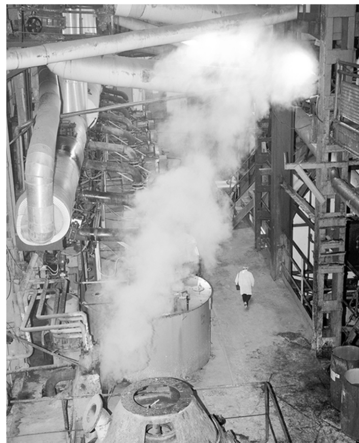
В одном из цехов сахарного завода.

Гордятся ветеранами и подерживая имеющийся коллектив, руководству ОАО «ЕКСЗ» думает и о новой смене. Заключён договор с Воронежским государственным университетом инженерных технологий, по которому студенты четвёртого курса приезжали сюда на расширенную практику. Практические весь сезон работают операторами, слесарями, внимают в тонкости производства, чтобы потом, после защиты дипломной работы, стать частью большого и сплочённого коллектива Елань-Коленовского сахарного завода.