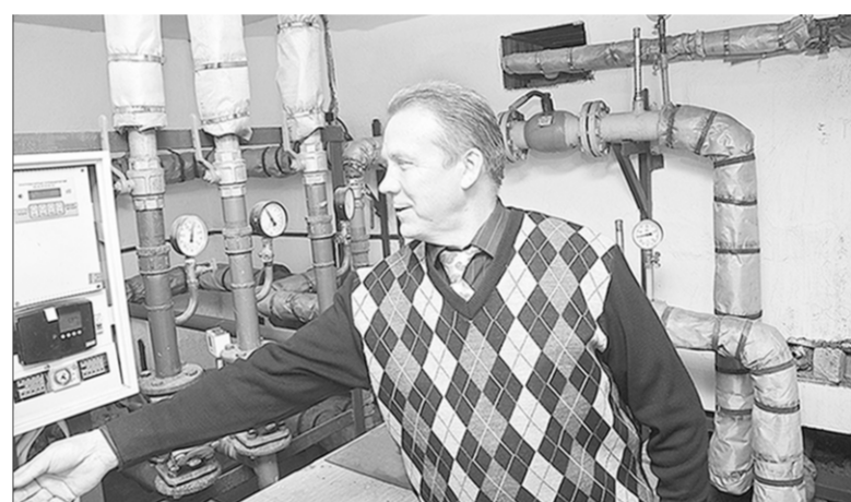
В ТСЖ «Перспектива», созданном в Коминтерновском районе города Воронежа, всегда полный порядок - хоть летом, хоть зимой.