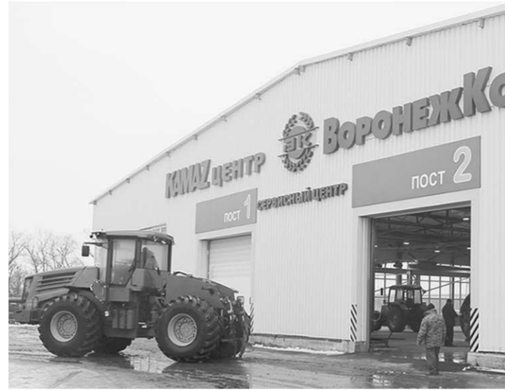
Трактор К-9430 въезжает в сервисный центр Лискинского филиала «Воронежкомплекта» для технического обслуживания.

Твои партнёры, село | В Лискинском филиале агроснабженческой компании «Воронежкомплект» состоялась презентация нового трактора К-9430 знаменитого Кировского завода