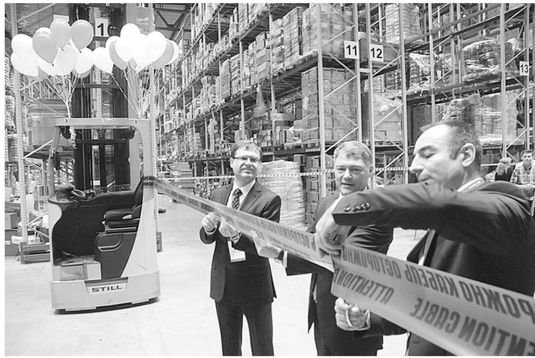
Торжественное открытие нового логистического комплекса.

Прекрасная техническая оснащённость, которой отличается логистический комплекс, позволяет оптимизировать затраты на хранение и транспортировку грузов, а также рационально использовать время и площадь. Его отличают полная автономность, развитая инфраструктура, технология хранения товаров в шесть ярусов. В модульной системе освещения применены самые современные светодиодные технологии от компании Philips, и она управляется датчиками движения одного из ведущих отраслевых производителей Shteiinel. Современные светотехнические решения позволяют достичь наряду с высоким уровнем