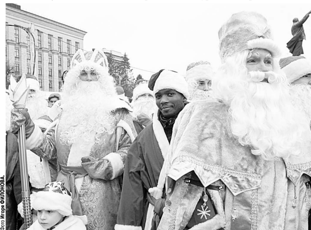
Парад Дедов Морозов дал старт новогодним чудесам.

Событие | Более 300 Дедов Морозов и Снегурочек собрались на площади Ленина Воронежа