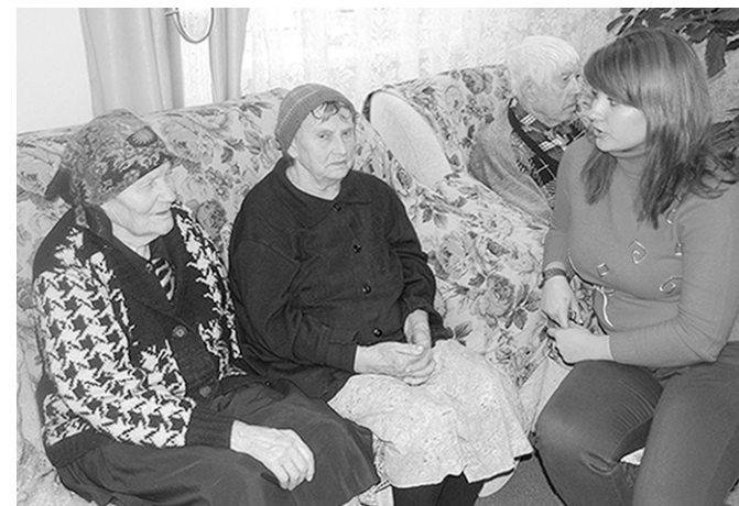
Общение – пожилым его часто не хватает.

«Скорая социальная помощь» вновь и вновь подтверждает простую истину: дела благотворительности и милосердия необходимы в нашей жизни; ведь помогая другим людям, мы тем самым помогаем и себе.