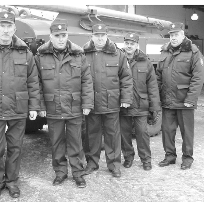
Добровольцы из Николо-Варваринки.

Огнеборцы аттестованы не только на тушение, они могут оказать необходимую помощь в ДТП или любых других сложных ситуациях. Профилактическая работа с населением – тоже зона нашей ответственности. График несения дежурства удобный – сутки через трое. И зарплата – достойная прибавка к уже имеющейся служебной пенсии.