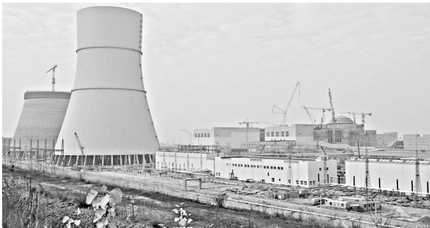
Особенно выигрышно выглядит Нововоронежская АЭС-2 со смотровой площадки. Отсюда по достоинству можно оценить новаторскую мысль и размах стройки.

минуту. В октябре в здании турбины завершён монтаж всех шести подогревателей сетевой воды. Оборудование является основным элементом теплофикационной части АЭС: предназначено для снабжения теплом объектов атомной станции и Нововоронежа.