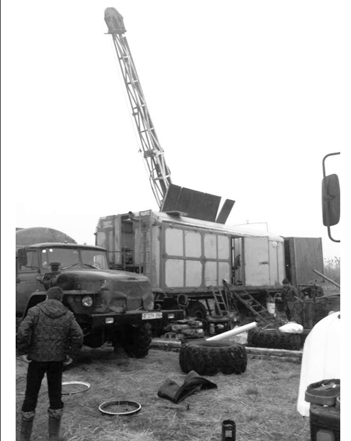
Так буднично выглядит работа геологов.

ЗАО «ОГК Групп» (подрядчик ООО «ММСК») (г. Москва) – консорциум, объединяющий ведущие сервисные геологоразведочные предприятия Российской Федерации. Компания специализируется на выполнении любых сервисных услуг по геологическому изучению недр в кратчайшие сроки, с высоким качеством и обеспечением договорных обязательств. Лицензия ВРЖ 15396 ТР на пользование недрами Елкинского участка была выдана Федеральным агентством по недропользованию ООО «ММСК» 26 июля 2012 года.