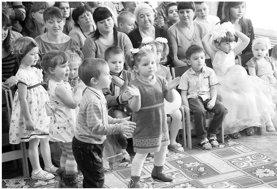
Второй дом – уютный и добрый.

Полученные на модернизацию системы дошкольного образования Репьёвского района 25,5 миллиона рублей позволили провести качественную реконструкцию помещений, заложить основательную материальную базу под будущее развитие детских садов.