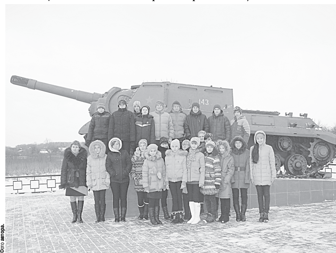
У обновлённого мемориала.

Память | Обновлённый мемориал на разрезе Пухово напоминает нам о подвигах героев Великой Отечественной войны