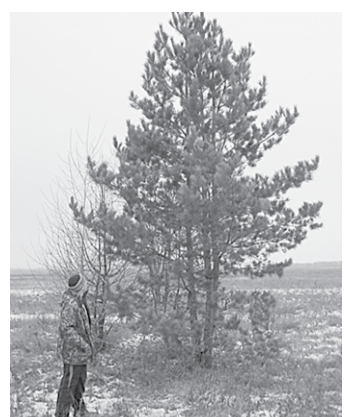
Пушистая красавица — для богучарской школы №1.

От богучарских школ №1 и №2 пришел сложный заказ, — рассказывает лесничий Подколотовского участкового лесничества Виктор Жураковский. — Для новогоднего праздника нужны были высокие четырехметровые сосны. Долго козелили по лесничеству с завхозами школ. Ведь нужно