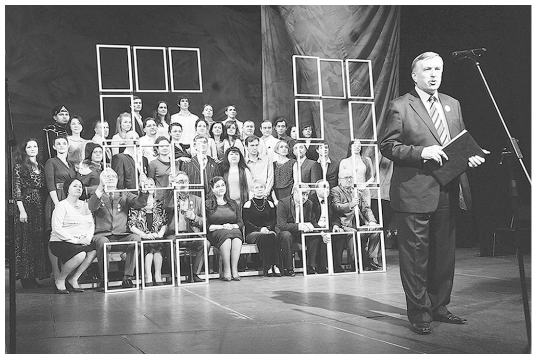
В начале представления на сцене появилась труппа ТЮЗа.

Вот уже в течение пятидесяти лет театр отмечает все свои круглые даты в один и тот же день. Происходит это в условиях предновогодней суеты, но у актёров Новый год вовсе не время отдыха: попутно готовится праздничный спектакль для самых юных зрителей, а кто-то примеряет костюмы Деда Мороза и Снегурочки.