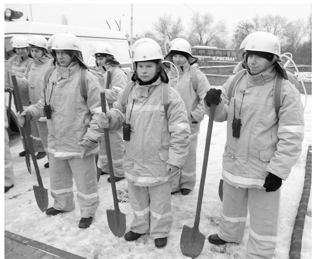
Пожарная команда из Воронежа.

В Воронеже обсудили состояние, проблемы и перспективы развития добровольной пожарной охраны