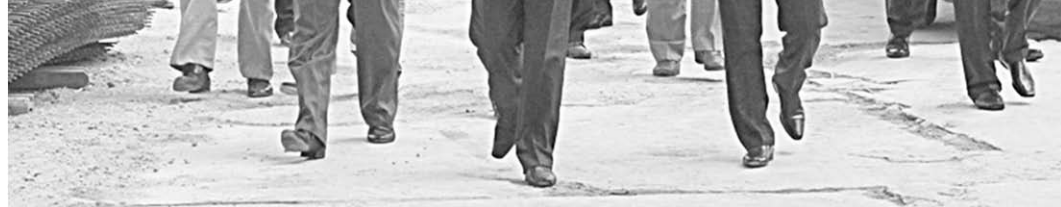
Визит генерального директора Госкорпорации «Росатом» Сергея Кириенко на Нововоронежскую АЭС-2 (2 августа 2013 г.).

Кстати, многие новшества, внедряемые на НВ АЭС-2, можно смело отнести к российскому ноу-хау. К примеру, впервые на распределительных подстанциях атомной станции использованы комплектные распределительные устройства 220/500 кВ с элегазовым изоляцией. Данное оборудование отличает компактность, надёжность и безопасность в обслуживании. Та же турбина энергоблока №1, основные работы по монтажу которой завершены в марте нынешнего года, будет самой крупной в России и по мощности – 1200 мВт, и по скорости вращения – три тысячи оборотов в