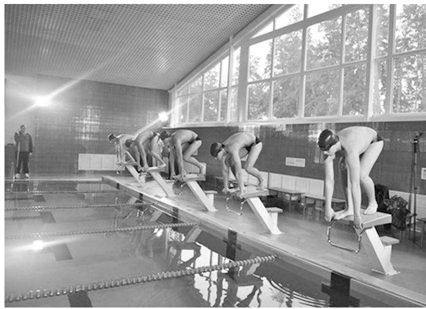
Пловцы на старте.

Для будущих лесоводов открытие плавательного бассейна к юбилею колледжа стало долгожданным событием и приятным подарком. После окончания торжественной части в новом бассейне состоялся первый показательный заплыв школьников и студентов.