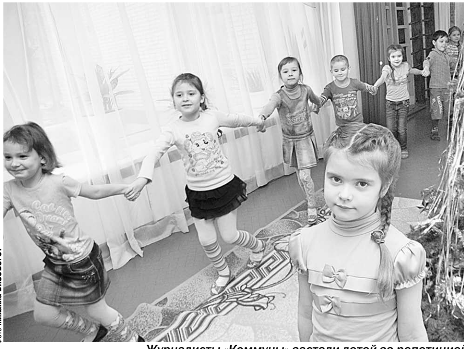
Журналисты «Коммуны» застали детей за репетицией к новому году утреннику.

Детсад №9 – единственный в районе – является стажировочной площадкой для Россошанского педагогического колледжа. Первые в своей жизни занятия с детьми будущие педагоги проводят в этом саду. Малыши из «Солнышка» – частые гости в детской библиотеке. Да и где, как не в стенах библиотеки познавать родной край, названия рек и сел Россошанского района.