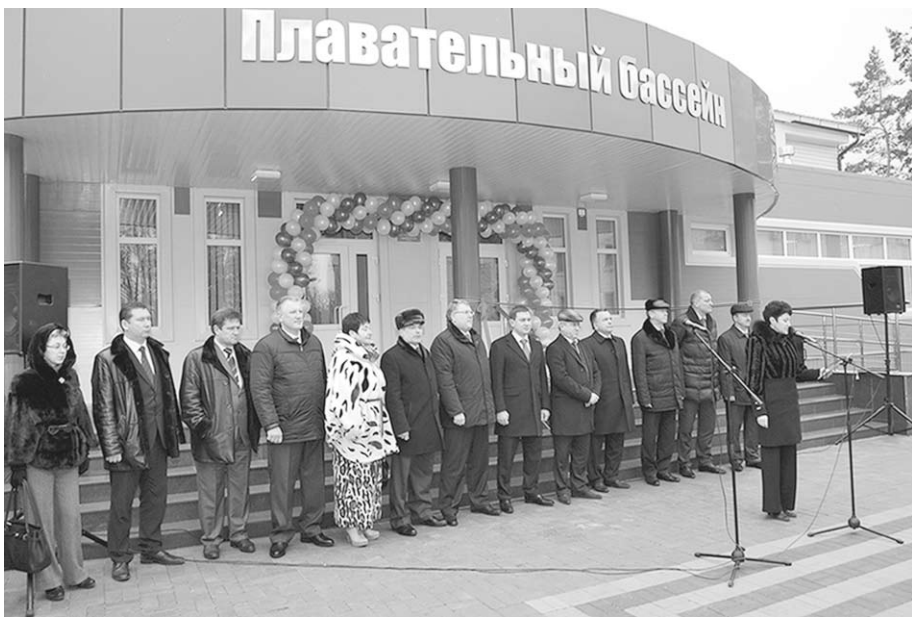
Торжественное открытие плавательного бассейна.

Осваивать технику плавания в бассейне станут, прежде всего, школьники и студенты Хреновского лесного колледжа. Г.Ф. Морозова. Строители, как и обещали, сдали объект по федеральной целевой программе «Развитие физической куль-