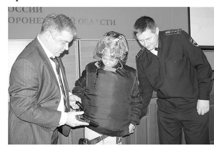
Кажному молодцу - к лицу.