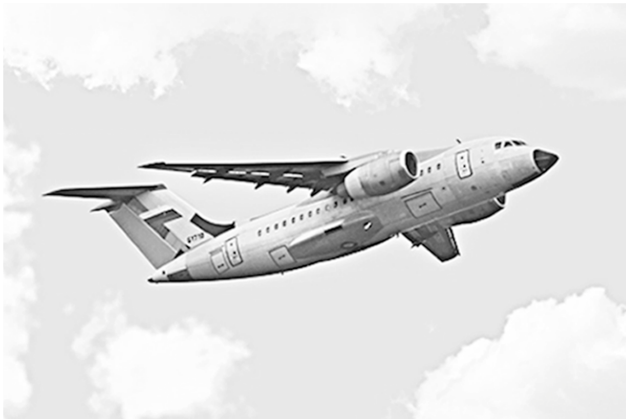
На ВАСО прошёл испытание первый Ан-148 по контракту с Минобороны РФ.

Экспертиза «Коммуны» | Показатели промышленного развития Воронежской области в этом году выглядят заметно скромнее, чем в 2012-м. Чем это вызвано? И какие перспективы у отрасли?