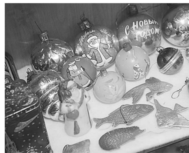
Новогодние игрушки из прошлого.

электрические приборы и мебель, одежду и обувь, мелкие безделушки полувекковой давности. У молодежи обычный интерес к старине, у пожилых возникает ностальгическое чувство. Ни в одном областном городе ЦЧР нет такой экспозиции, поэтому тем более удивительно совершеннейшее равновозрастные властей к энтузиазму общественных «ревнителей старины».