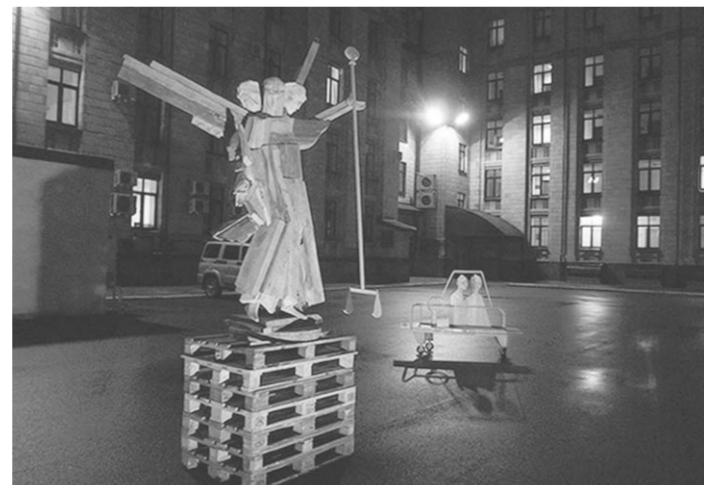
Ангел под открытым небом.