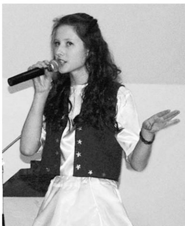
Каждое выступление зал принимал доброжелательно.

Надо сказать, что гости мероприятия с удовольствием проводили время у ярмарочных лотков с поделками. Каждая из них – на-