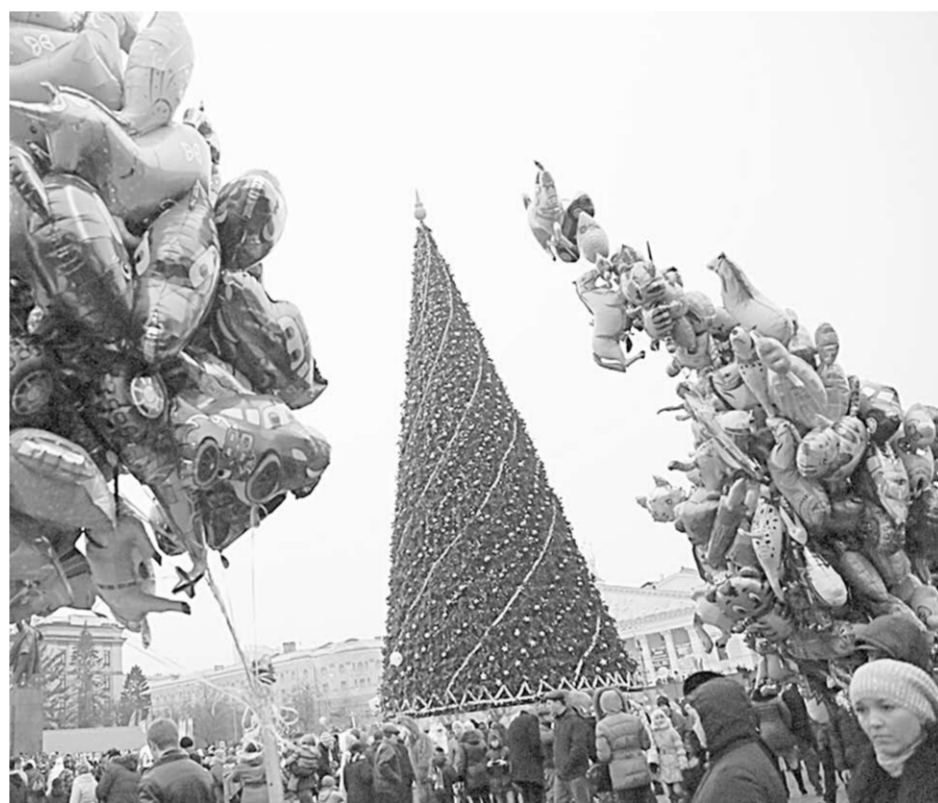
У главной ёлки Воронежской области.

«2013 год прошёл в работе над проектом. Я хочу выпустить книгу «Семь счастливых нот» для детей с ограниченными возможностями. Всё это для того, чтобы талантливые и интересные детки попробовали свои силы в музыке, и вообще в искусстве. Желая всем в новом году предрасных дней, чтобы дети росли счастливыми, и никогда не было войн. Расскажу стих собственного сочинения для новогоднего настроения. Называется «Необычный Новый год»: