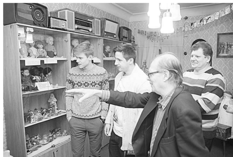
Такое увидишь не в каждом музее.