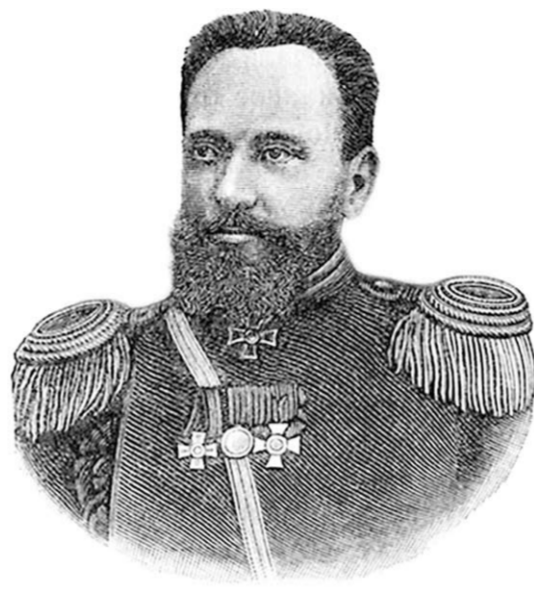
Конструктор оружия Сергей Мосин.

В 1854 году в связи с кончиной Н.И. Тулинова в описи его усадьбы фигурирует «двухэтажный дом каменный, покрыт железом, под окраской, длиной 33 1/2 арш., и шириною 15 арш., вышиною 8 ар.». Вверху обозначены 2 «порожних»