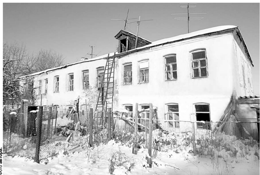
Подлинный дом управляющего. 2013 г.