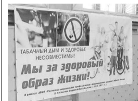
Такой плакат встречал всех проходящих в школу №62.

В ноябре-декабре прошедшего года Воронежский областной центр медицинской профилактики проводил пилотный проект «Здоровье подрастающего поколения».