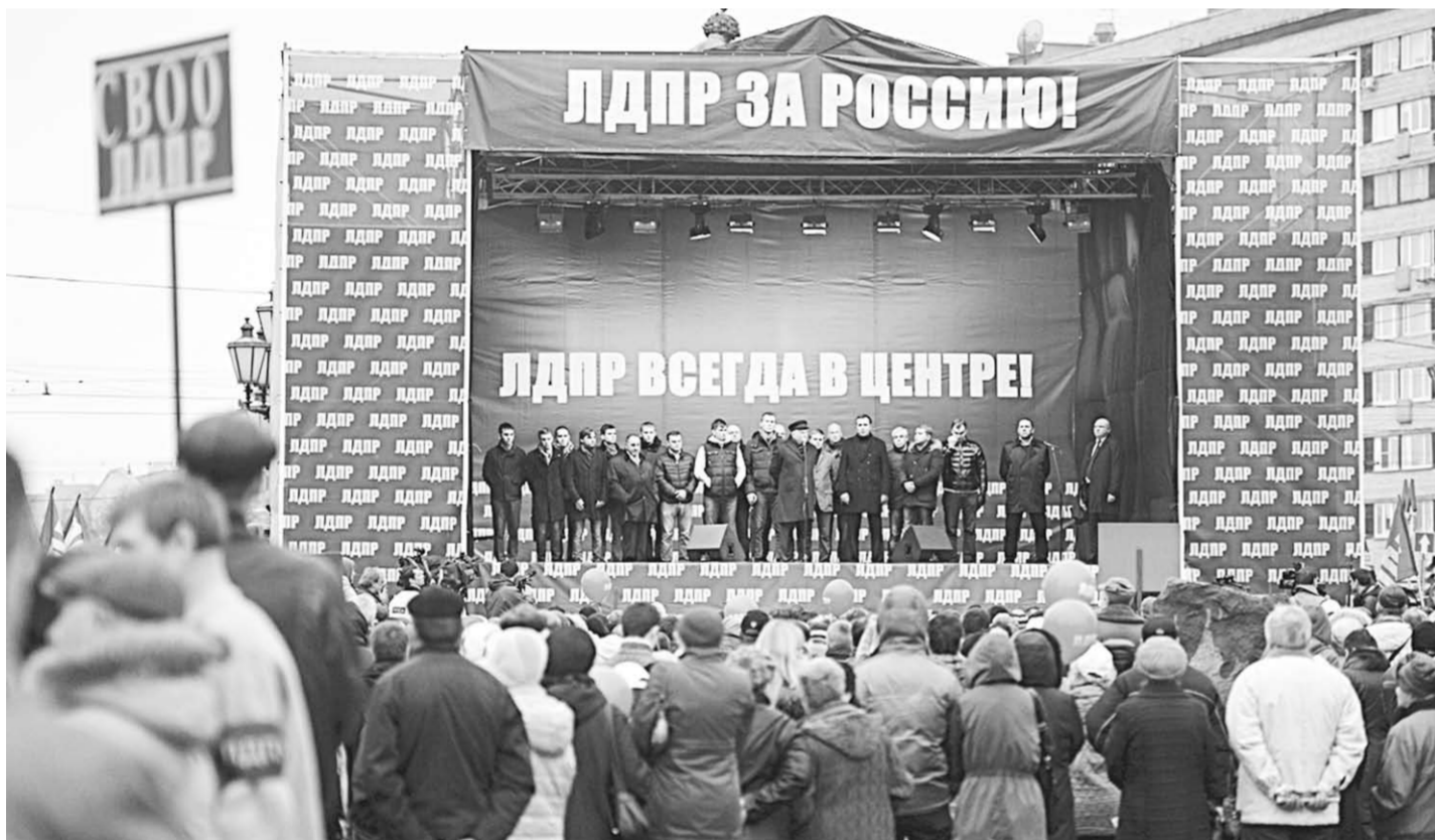
Лозунги ЛДПР близки и понятны миллионам россиян.

И это богатство Россия стремительно теряет.