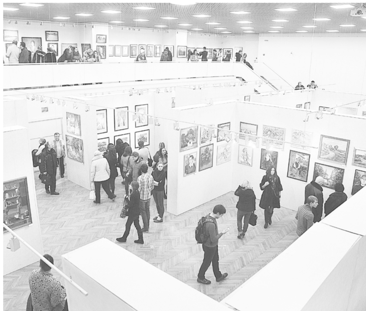
Бесплатное приобщение к культуре вызвало у воронежцев небывалый ажиотаж.