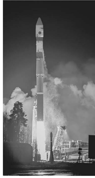
Пуск ракеты-носителя «Союз-2.1в».

✓ В создании ракеты и двигателей для неё большой вклад внесла молодежь, то самое новое поколение, которое переключается сейчас с седловых велосипедов на новые компьютерные технологии, современные станки и оборудование.