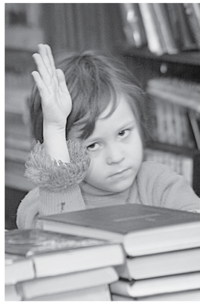
Скоро десятки учебников по истории Отечества заменит один. Станет ли прошлое России понятнее для современных школьников и их учителей?