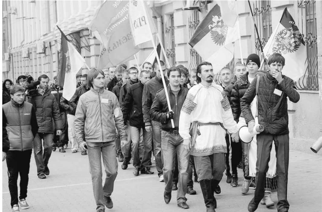
Русский вопрос: молодежь ищет ответы.

убеждение, согласно которому «термин «русский» нас разъединяет», а «принятие Православия – трагедия для России». В сфере культуры, как в массовой, так и «элитарной», мы наблюдаем апофеоз пошлости, навязывание различных форм девiantного поведения, введение ненормативной лексики в культурное пространство, явную или латентную пропаганду различных форм нетрадиционной сексуальной ориентации и т.д. Вряд ли СМИ в том виде, в каком они функционируют сейчас, могут способствовать процессам национальной идентичности, скорее, наоборот.