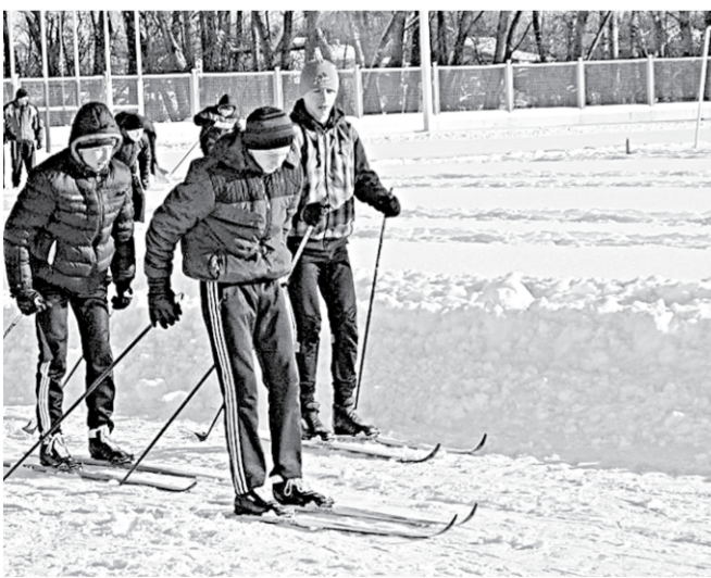
Праздник спорта объединил взрослых и детей.

Всего в этот день на стадионе собрались более двухсот человек. Самые сильные, смелые и умелые получили призы, подарки и, главное, хорошее настроение. В помощь спортсменам была и погода – судя по нынешним морозам и прогнозам на ближайшее время, в Калаче ещё не раз будет возможность устраивать ледовые праздники.