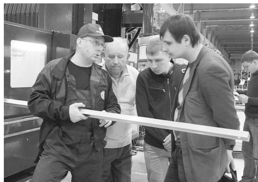
Практика на заводе «Воронежсельмаш».

МЫ ЖДЁМ ВАС ПО АДРЕСАМ: ■ проект Революции, 19 (факультеты: экономики и управления, технологического, экологии и химической технологии, пищевых машин и автоматов, управления и информатики в технологических системах); ■ Ленинский проспект, 14 – факультет среднего профессионального образования.