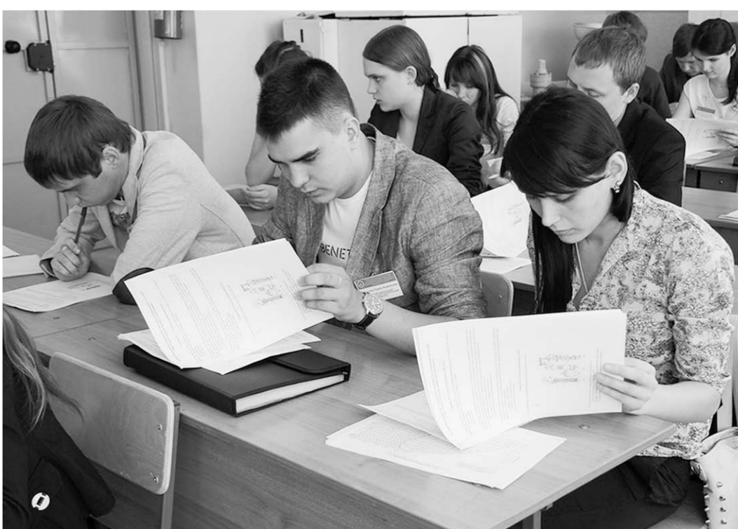
Всероссийская студенческая технологическая олимпиада.