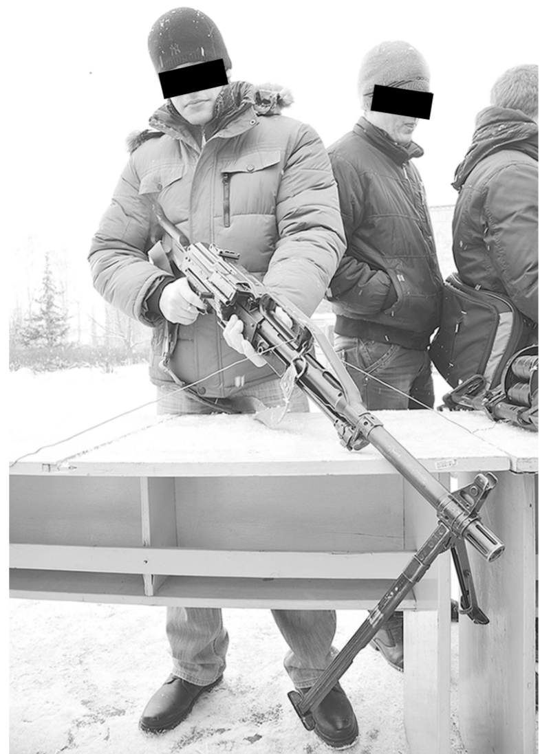
Интерес мальчишек к оружию понятен, но как им объяснить, что существует черта, которую нельзя переступать...

ников телевизионных ток-шоу: учителей, одноклассников, депутатов, психологов и юристов, надеялась получить ответы на возникшие вопросы: что заставило подростка, которым гордились педагоги и родители, взять в руки отповские карабин и винтовку и отправиться с ними в класс? Почему никто не обратил внимания на подростка в женской шубе, который, прежде