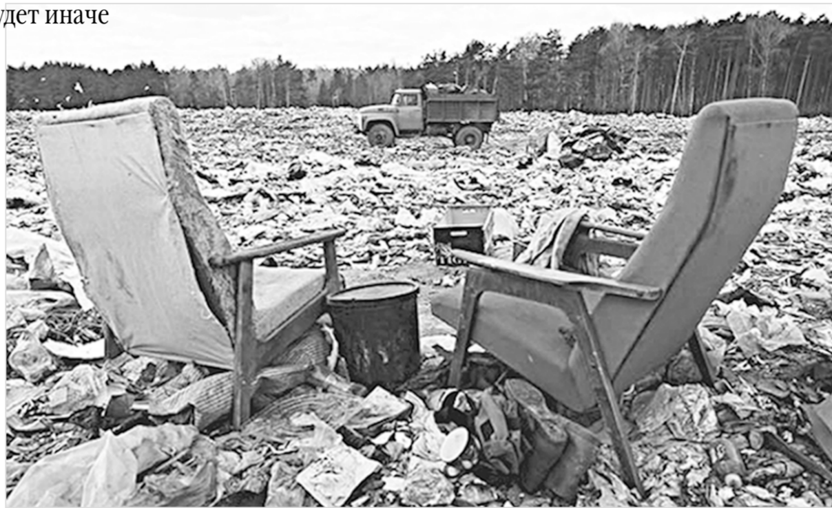
Надо полагать, руководящие кресла во всех восьми создаваемых межмуниципальных отходов перерабатывающих комплексах займут толковые руководители, а не корыстные дельцы, способные обогащаться даже на мусоре.

При этом, как уверяет руководитель департамента природных ресурсов и экологии Воронежской