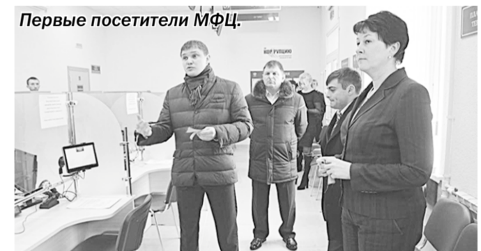
В Калаче начал действовать многофункциональный центр предоставления государственных и муниципальных услуг.