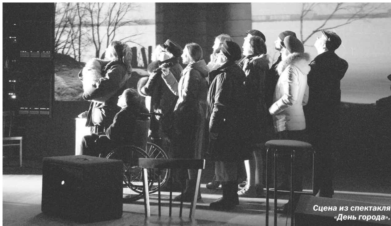
Сцена из спектакля «День города».