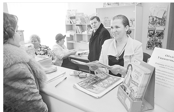
В день открытия зимних Олимпийских игр в Сочи под Воронежем в селе Ступино тоже произошло событие, значимое для местных жителей.