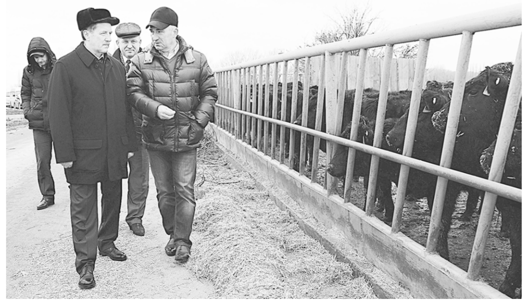
Губернатор посетил животноводческий комплекс.