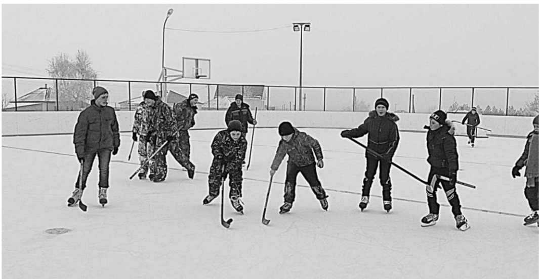
Хоккейный сезон в разгаре.

– Конечно. Мы очень детально работали над этой проблемой. Благодаря тому, что на территории нашего сельского поселения есть градообразующее предприятие, есть и средства для финансирования строительства детского сада.