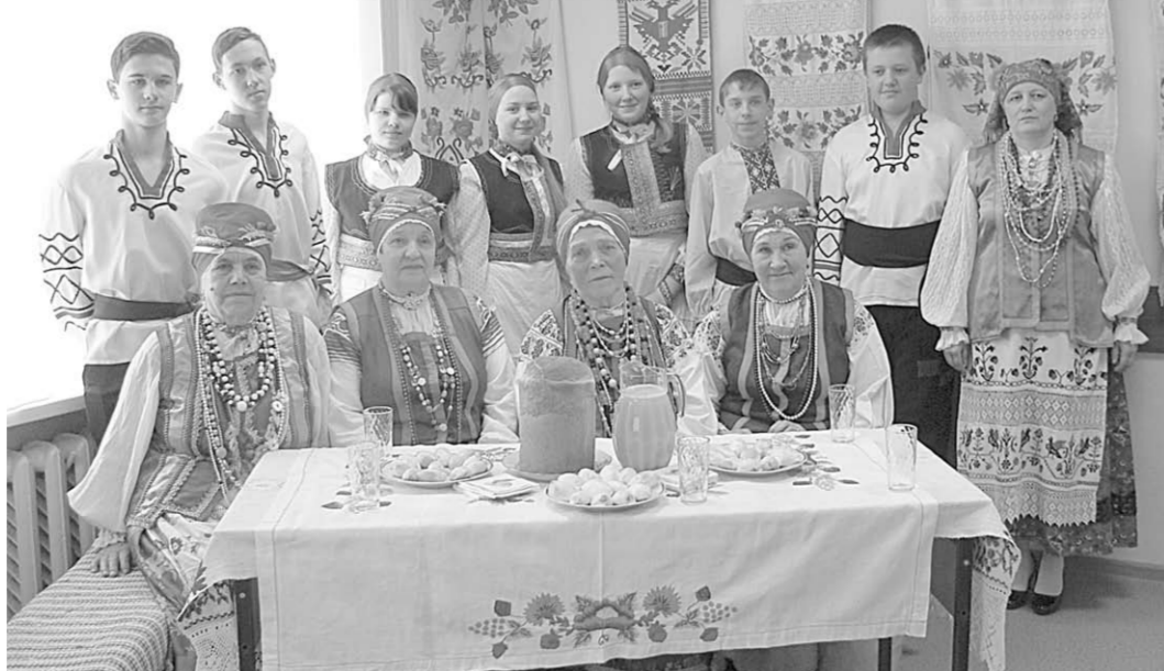
В «Горнице» лучшие голоса павловской земли – «Донские родники» и «Кукушечка».