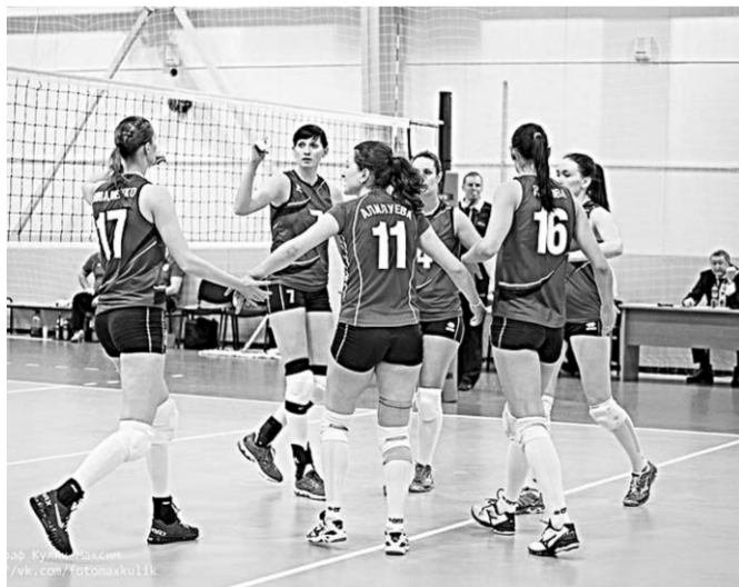
Воронежские волейболистки порадовали себя, и болельщиков.