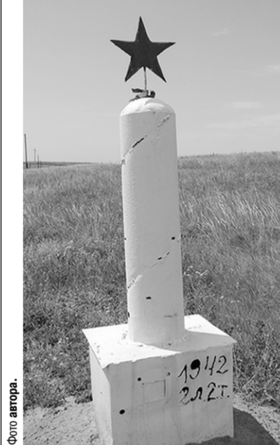
Такие обелиски дорожного стоят. Они сооружены простыми людьми по зову сердца. И они — залог того, что память народная не позволит предать забвению безвестных героев той войны.