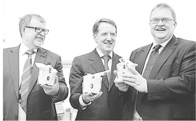
Результат совместного проекта.