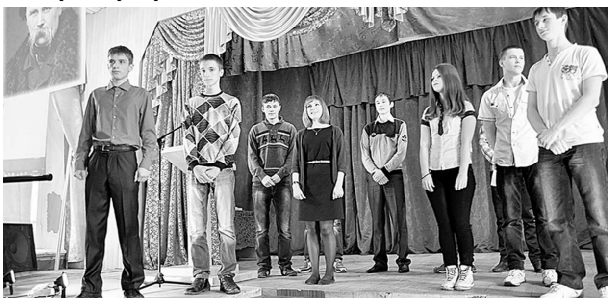
Студенты педагогического колледжа на вечере, посвящённом 200-летию Тараса Шевченко.

Лучшие страницы в творениях Тараса Григорьевича Шевченко, а писал он как на украинском, так и на русском языках, тоже наше общее