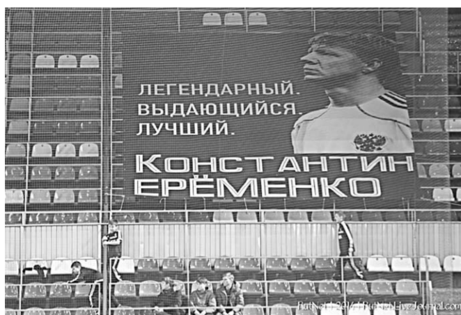
Баннер на трибуне МСА «Лужники».