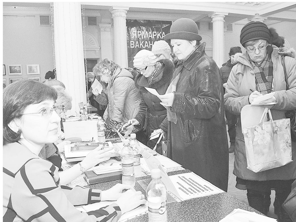
Ярмарка вакансий: всё для милых дам.