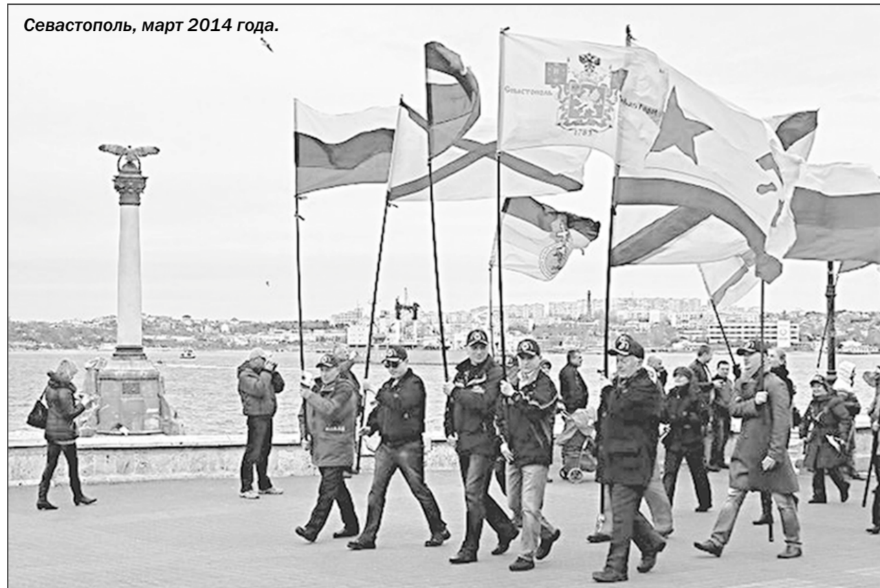
Севастополь, март 2014 года.