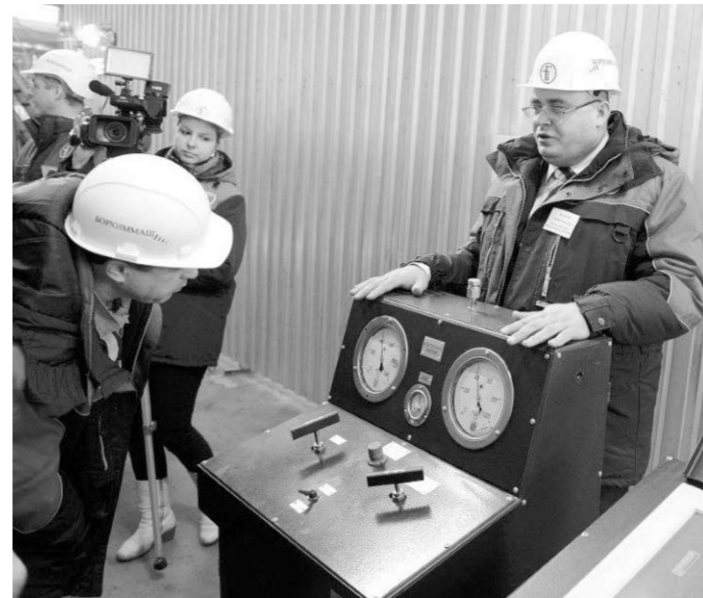
В сложнейшем производстве не может быть никаких мелочей.

В исторической стройке «Борхиммаш» принимает непосредственное участие. В 2013 году для магистрального газопровода этого проекта ОАО «Борхиммаш» только на территории центрального ФО оснастило аппаратами воздушного охлаждения три