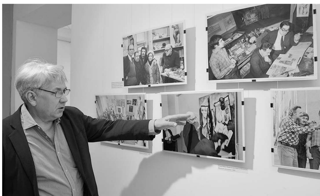
Благодаря выставке в воронежской галерее мы можем взглянуть в лица художников.