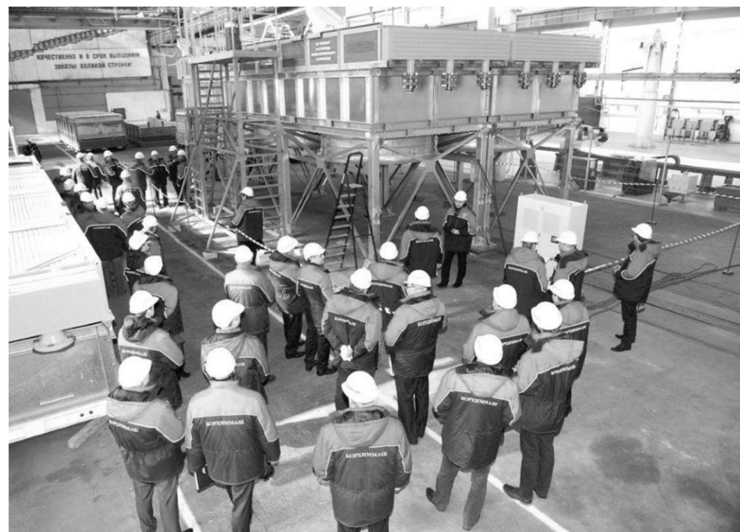
Гости в цехах ОАО «Борхиммаш».

По результатам типовых испытаний подписаны протоколы и акты, в которых было отмечено, что все испытания аппарат прошел успешно, подтвердив заявленные характеристики, и он рекомендован к серийному выпуску. Что и говорить, событие, которое состоялось на ОАО «Борхиммаш», поистине историческое. Ведь, как и десятилетия назад, когда завод начал комплектовать своими АВО строительство газопровода «Уренгой-Помарь-Ужгород», сегодня предприятие выходит на газпромовский проект не меньшего, а куда большего размаха. И надо полагать, что за крупными поставками аппаратов на КС «Русская» последуют и иные заказы от ОАО «Газпром» и других крупнейших компаний страны.