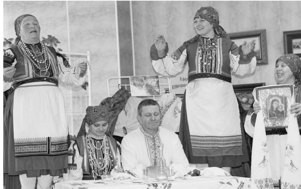
Участники встречи показали народные костюмы своих сёл.

Общаясь с коллегами из других районов, она видела, что библиотекари очень заинтересованы и трепетно относятся к сохранности предметов быта старинных, аксессуаров женской одежды, которую когда-то носили их прапрабабушки. Библиотеки в некоторых сёлах даже больше напоминают музеи, где собраны старинные предметы бытовой утвари, а главное, образцы старинной одежды селянок. Вот и решили лискинцы, бровровцы, репьевцы и каменцы показать и рассказать об истории народных костюмов своих сёл, их особенностях и традициях, о местных приданиях и обрядах. Встреча эта вылилась в колоритный, яркий и взаимопользительный фестиваль – с выставками, песнями, театрализованными представлениями, виртуальными экскурсиями по музеям истории сёл.