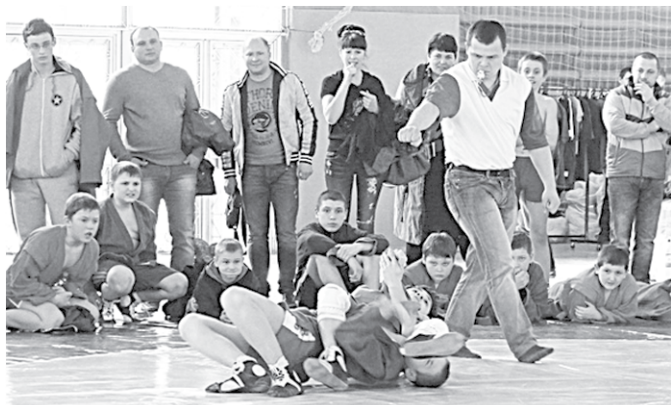
Детский турнир по самбо.