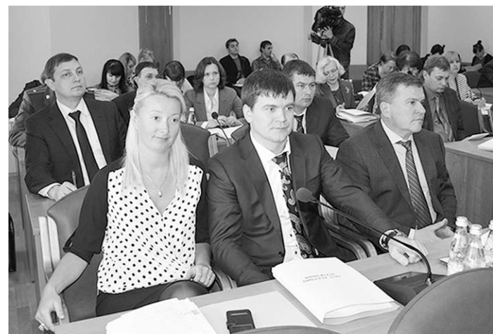
На сессии городской думы.