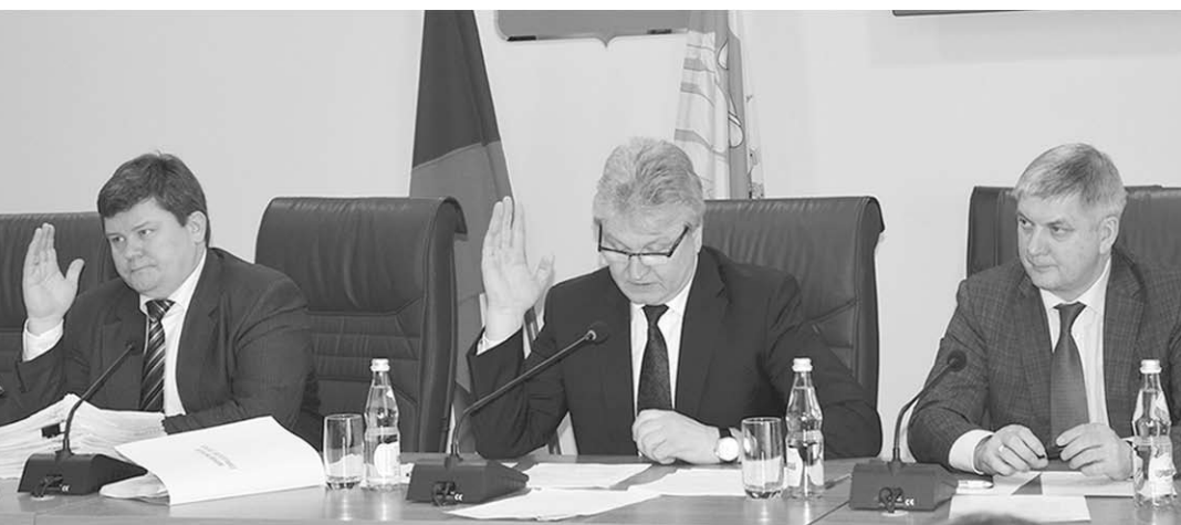
На сессии городской думы.

В ходе заседания парламентарии разрешили мэрии реализовать имущество, находящееся