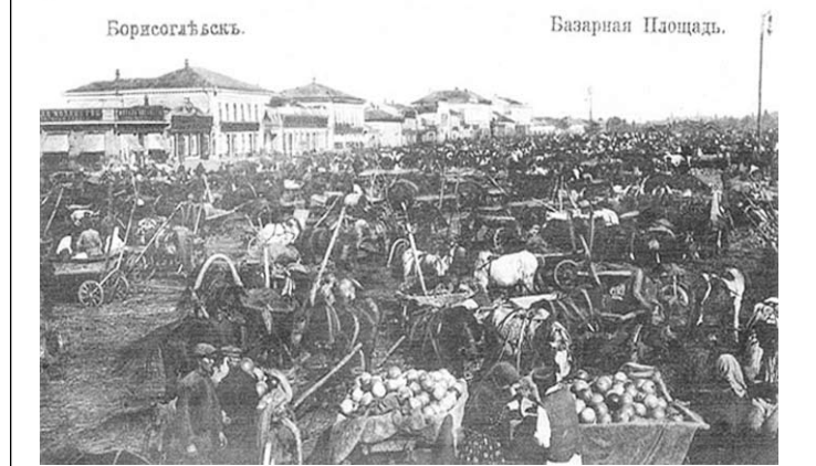
Базарная площадь города. Вид на часть улицы Большой от Народного дома. 1910-е годы.