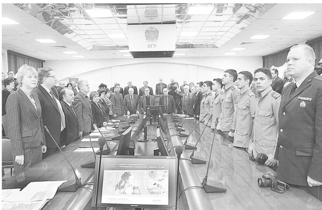
Российские и кубинские учёные и студенты на заседании Учёного совета ВГУ.