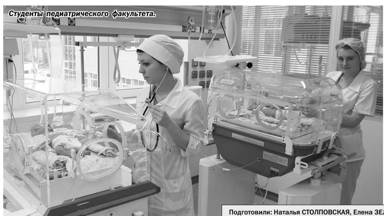
Студенты педиатрического факультета.