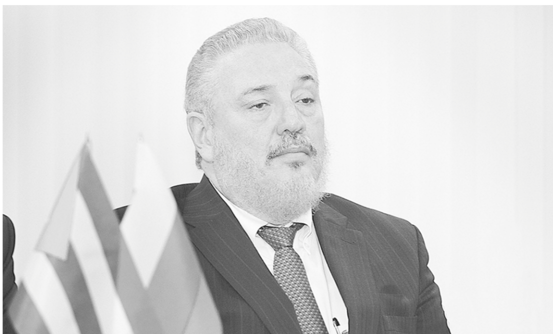
Фидель Кастро Диас-Баларт.