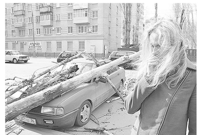
Воронеж, ул. Краснознаменная. Девушке крупно повезло – дерево свалилось на капот машины, а не ей на голову.

Сегодня энергетики, коммунальщики и другие пострадавшие от неблагоприятных погодных явлений продолжают работу. К счастью, случаев травматизма среди населения не зафиксировано.