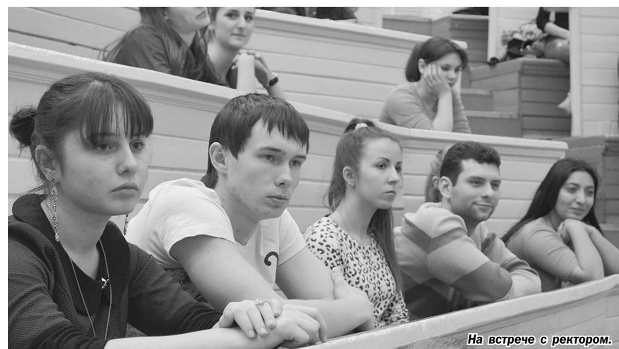
На встрече с ректором.