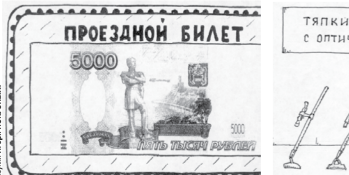
Рисунок Игоря ИСКОЛЬНИКОВА.

* Драма - когда женщина уходит, трагедия - когда остаётся.