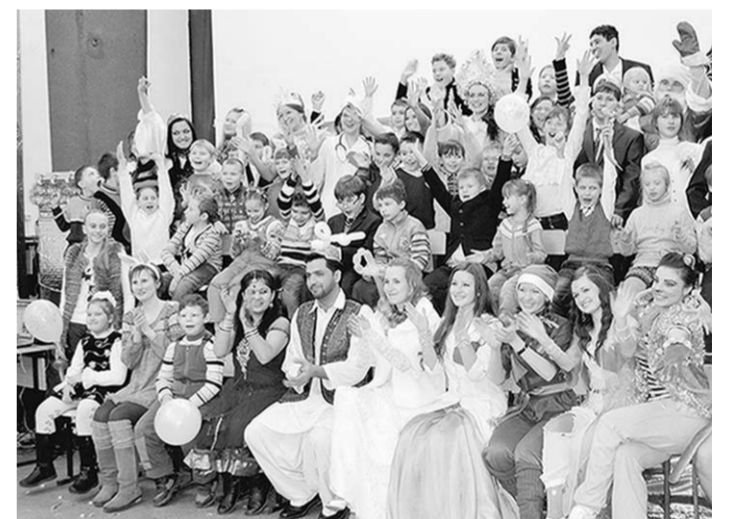
В гостях в академии.

Интерес к теме не случаен. Увлечённость космической темой подхватили студенты ВГМА. Вначале они приняли участие в