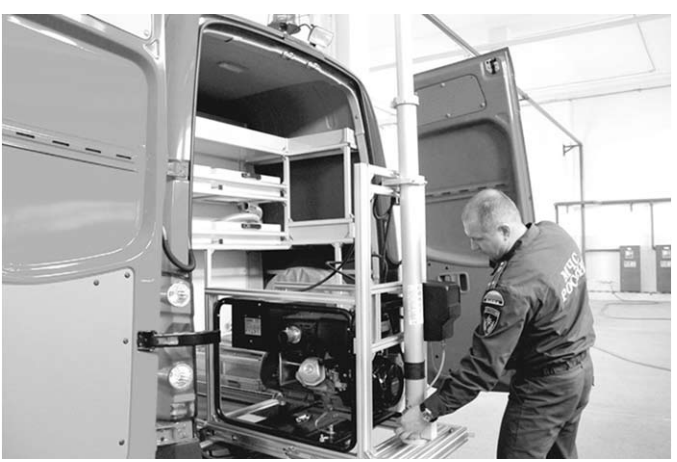
С такой техникой и сложные задачи по плечу.