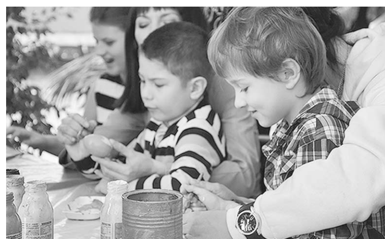
Главная задача – социализация этих детей.

Информирование общества и власти о проблемах «особенных» детей не менее важно, чем оказание им медицинской помощи, – убежден депутат Воронежской городской думы, главный врач