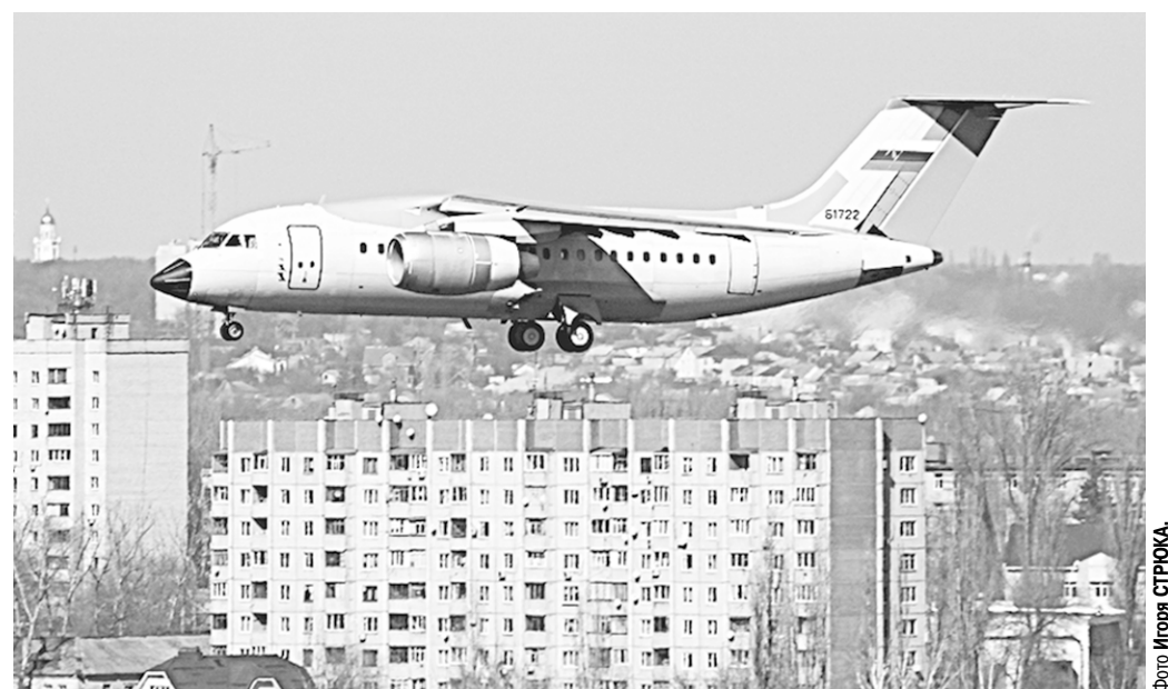
Ан-148-100Е в воронежском небе.

Нанюмин, в соответствии с государственным контрактом, ВАСО в течение 2013-2017 годов построит для Минобороны РФ пятнадцать ближнемагистральных самолётов Ан-148-100Е. Первый борт официально передан в декабре 2013 года.