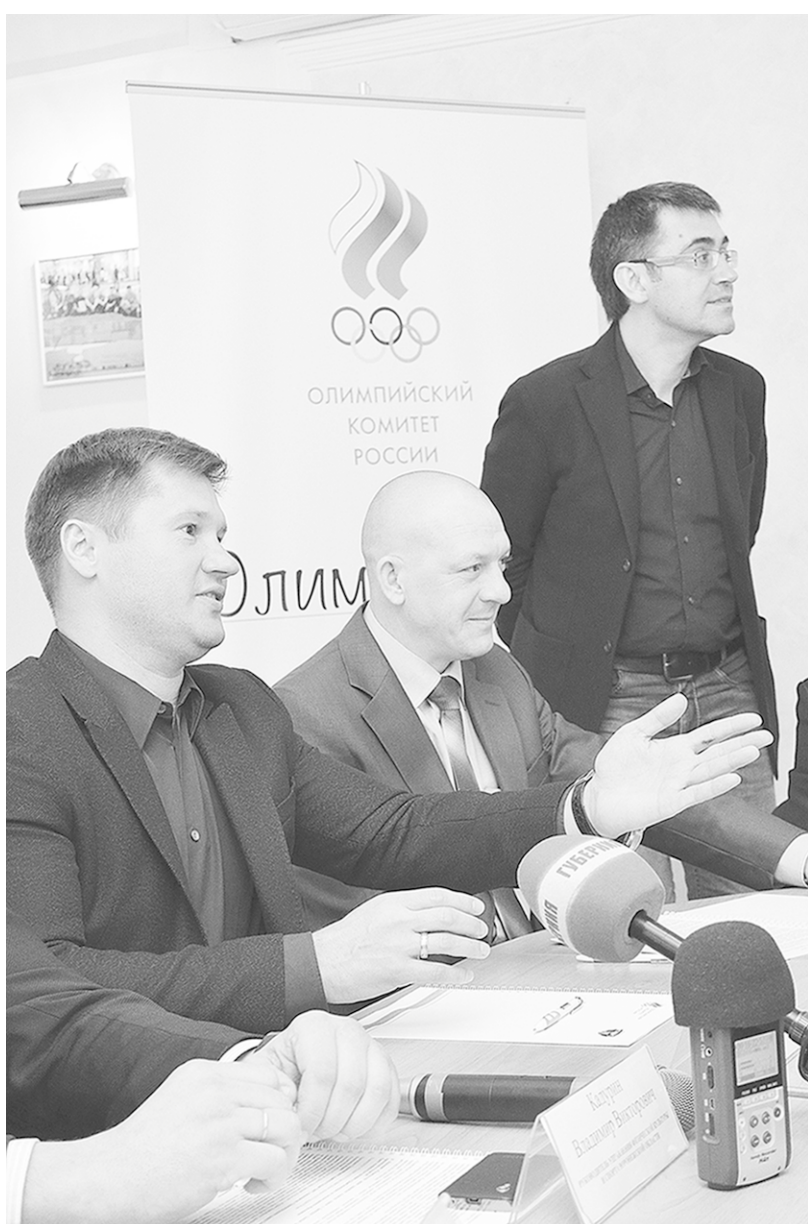
Два олимпийских чемпиона – Алексей Немов и Дмитрий Саутин.

Зашёл разговор на уроке и о самом скандальном выступлении в спортивной карьере гимнаста, когда его по большому счёту судьи лишили золотой медали. В августе 2004 года на Олимпийских играх в Афинах после феерического выступления Немова арбитры выставили российскому спортсмену 9,725 балла. Это всё равно, что за ответ на «пять» на уроке получить «троечку». Причём с минусом. С низкими оценками не согласился зритель, и весь многотысячный зал 15 минут не давал продолжать состязание. Алексею Немову ничего не оставалось, как подняться на помост и, подняв руки, попросить людей успокоиться. Два арбитра, просмотрев повтор выступления, пересмотрели свои оценки, но это не помогло российскому гимнасту подняться на высший пьедестал почёта.