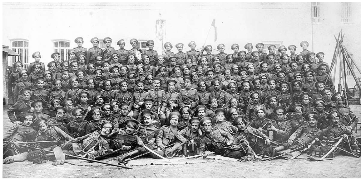
Перед боем всей ротой они сфотографировались на карточку. А сколько их осталось после сражения?..

Вернисаж | В Воронежском театре оперы и балета открылась выставка, посвящённая 100-летию начала Первой мировой