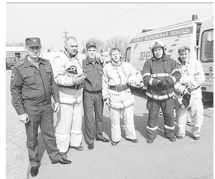
Дружина чемпионов из Воронежа.

Воронежские спасатели вновь стали лучшими в Центральном федеральном округе.