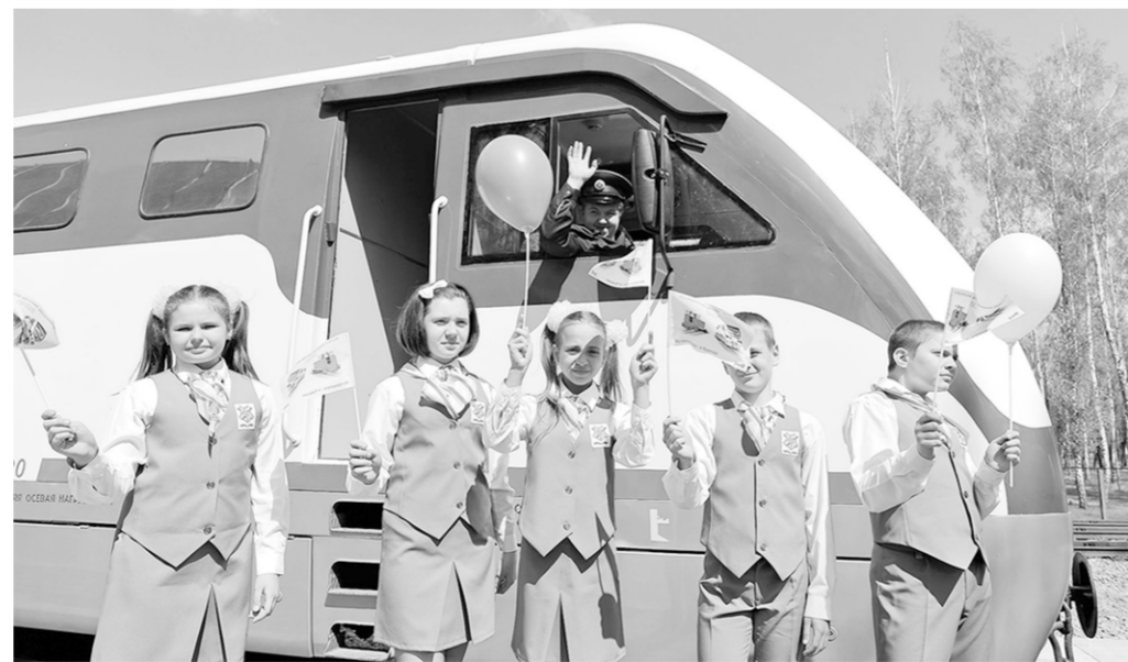
Дети рады подарку - настоящей железной дороге.