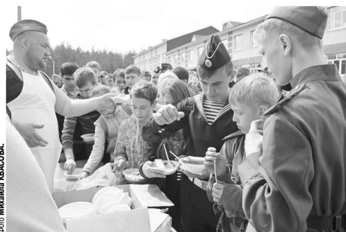
Хороша солдатская каша!

Фоторепортаж | Шуберские школьники стали участниками военной реконструкции