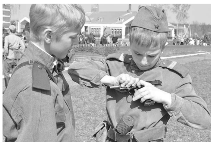
Полное боевое снаряжение: граната за поясом, пистолет в руках.