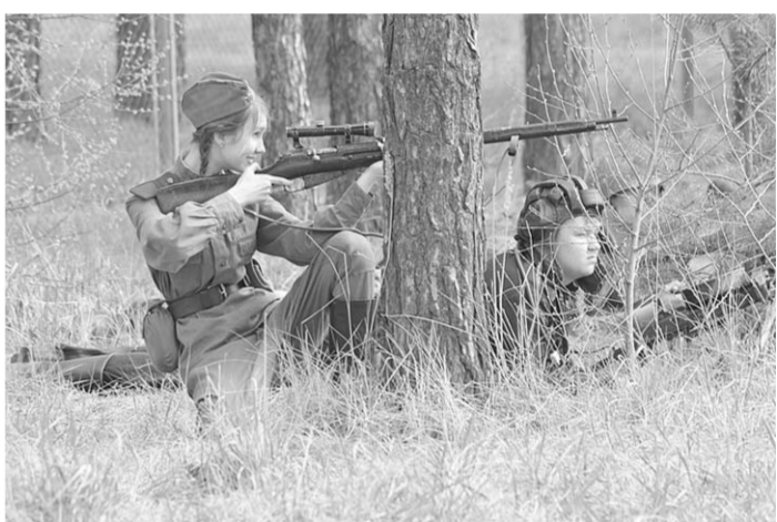
Винтовка девушке к лицу.