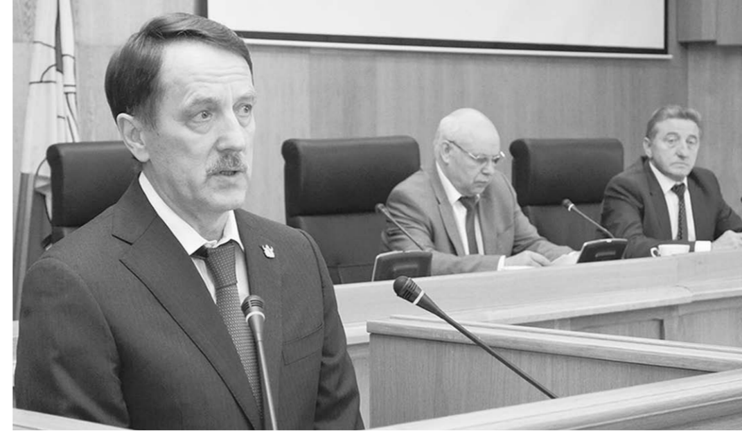
Алексей Гордеев: «Опираясь на выработанные совместные решения, легче двигаться вперед».