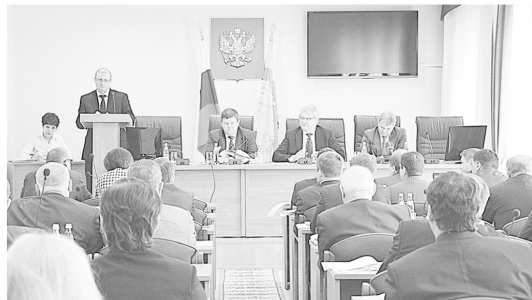
На 61-м заседании Воронежской городской думы.

Также на заседании депутаты приняли ряд решений, касающихся муниципальной собственности, и заслушали отчет о работе Контрольно-счетной палаты городского округа Воронежа.