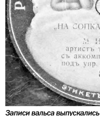
Записи вальса выпускались на граммофонных пластинках.