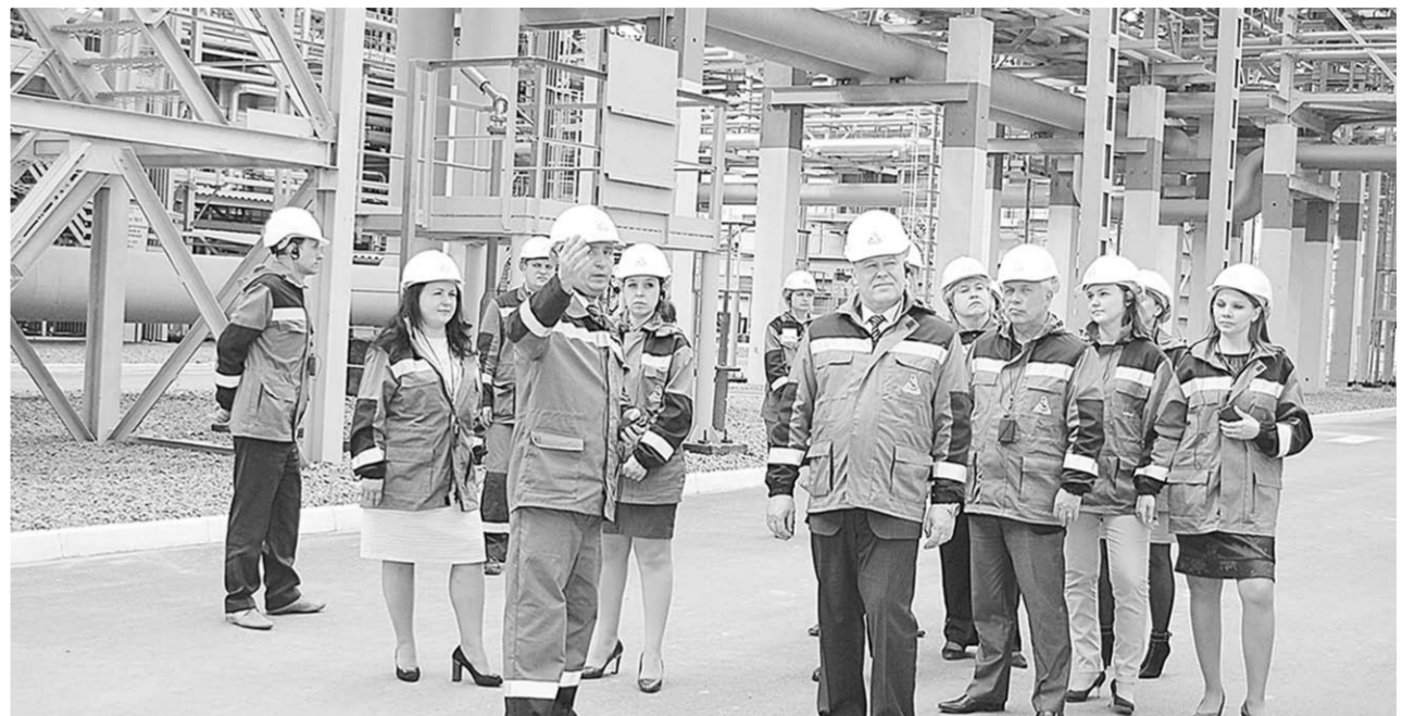
На территории завода.

В цифрах «Воронежсинтезкаучук», по данным главного инженера, выглядит так: коллектив завода - 2331 человек, средний возраст работника 40 лет, более 40 процентов специалистов имеют высшее образование, средняя