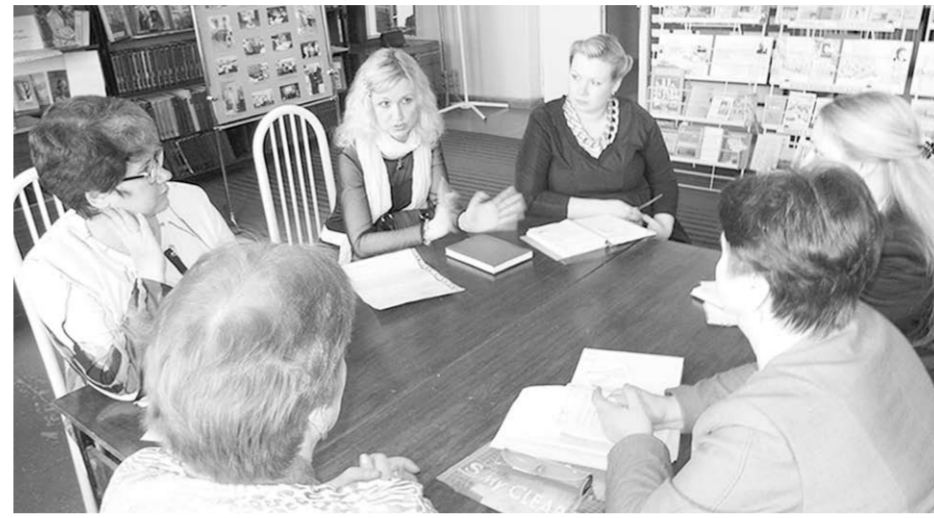
На одной из площадок форума.

Проблемы водоснабжения и тарифообразования; освещения сельских поселений; строительства и ремонта дорог, особенно к социально значимым объектам;