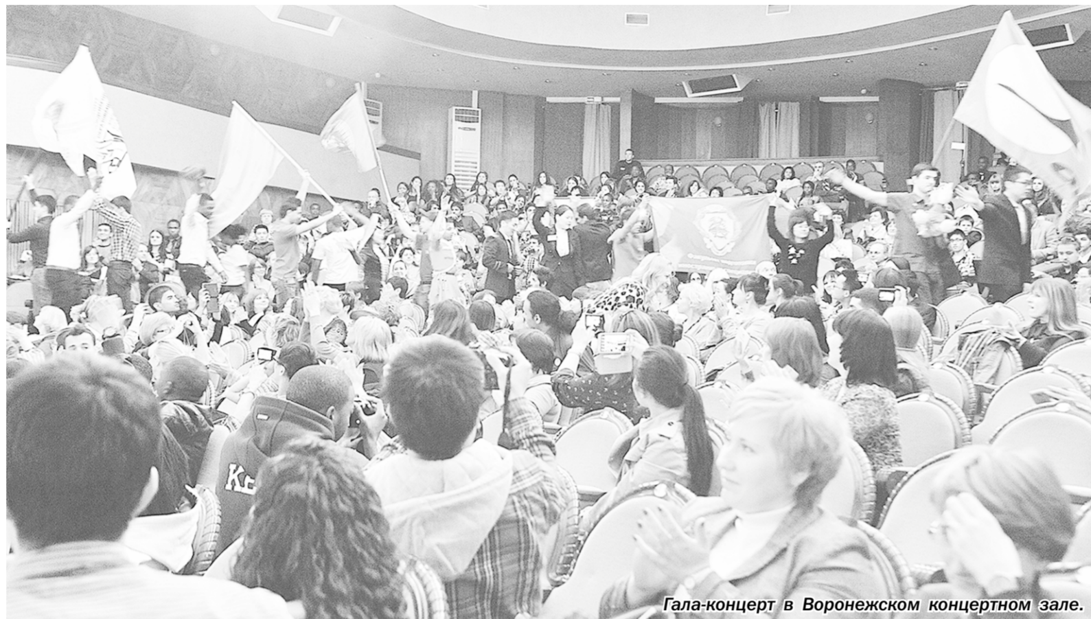
Гала-концерт в Воронежском концертном зале.

Вузы | Гости из семнадцати городов России приехали в Воронеж, чтобы принять участие в седьмом фестивале русской речи иностранных студентов вузов