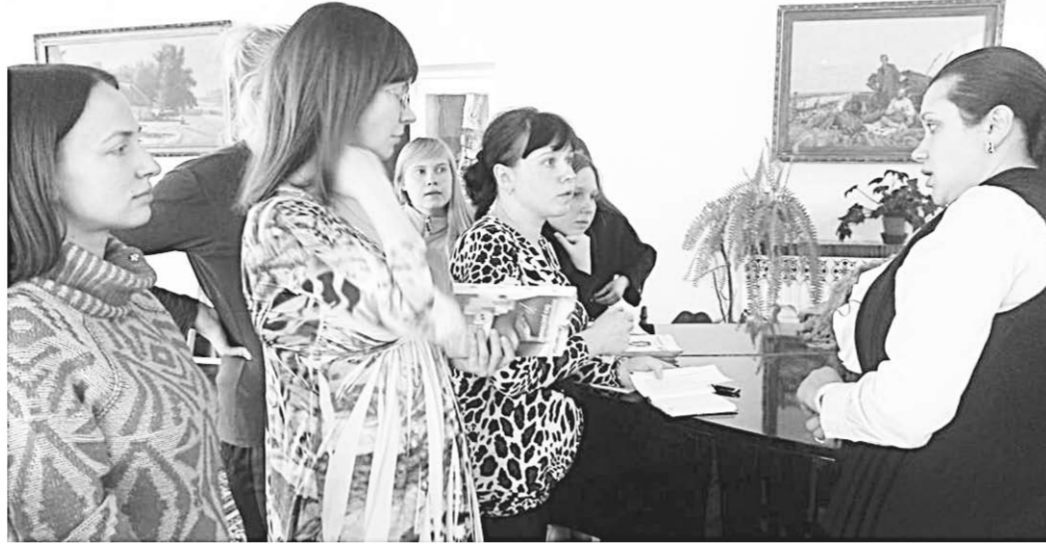
Молодые мамы – прилежные ученицы.