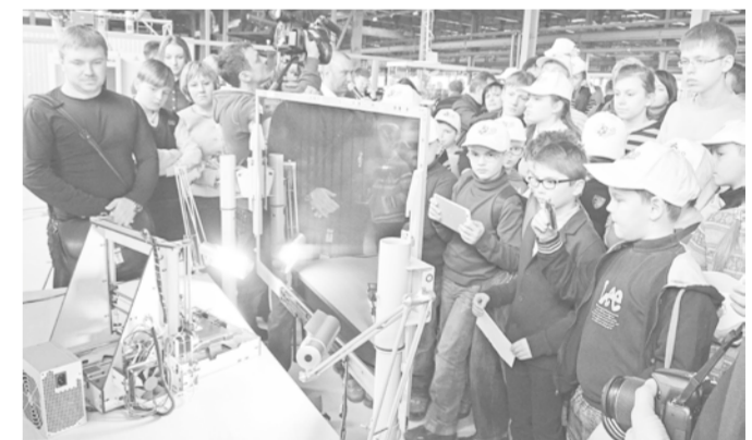
В апреле Центр аддитивных технологий «Воронежсельмаш» презентовал первый серийный бытовой 3D-принтер.