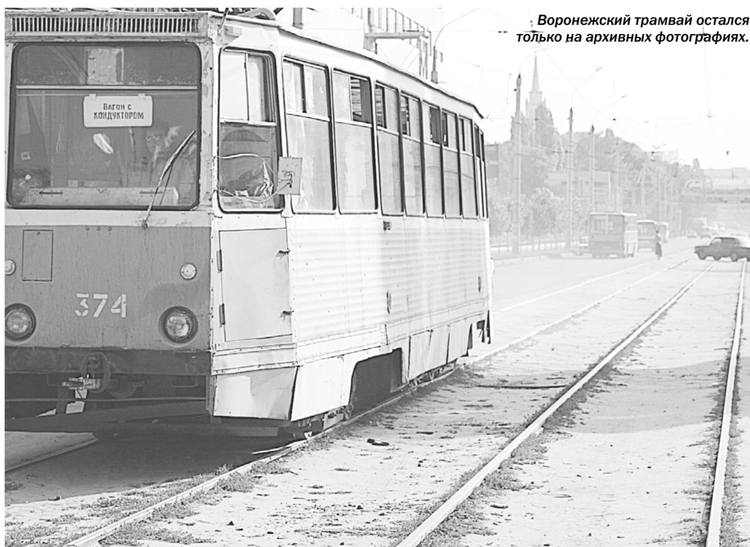
Воронежский трамвай остался только на архивных фотографиях.

Мегаполис | Решение о ликвидации рельсового транспорта в Воронеже оказалось ошибочным, считают эксперты