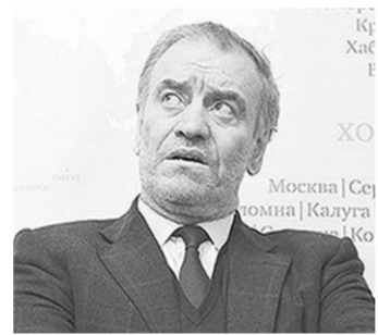
Мастро Гергиев перед началом концерта.

музыкантам рукоплескали в Казани и Екатеринбурге, Иркутске и Якутске, Хабаровске и Новосибирске. Воронежский концерт, состоявшийся при поддержке областного правительства, состоялся в театре оперы и балета.