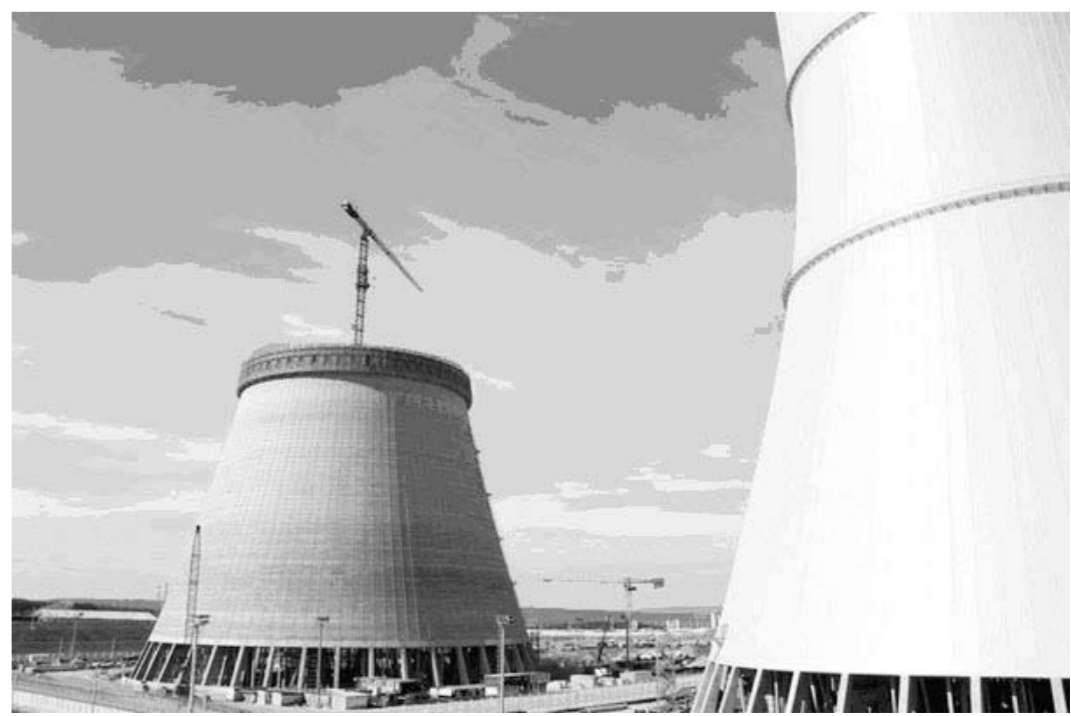
На строительной площадке НВ АЭС-2.

Градирия – гидротехническое сооружение, предназначенное для охлаждения воды. На Нововоронежской площадке возводится одна башенная испарительная градирия на энергоблок вместо двух, как это было на отечественных АЭС ранее. Такое решение позволяет существенно снизить капитальные затраты, расход электроэнергии на собственные нужды, а также уменьшить площадь промышленной площадки АЭС при сохранении всех требований технологии и безопасности. Проектный срок службы строительных конструкций градири – до 100 лет. Сооружение градири ведёт ОАО «Мостостроительный трест № 6».