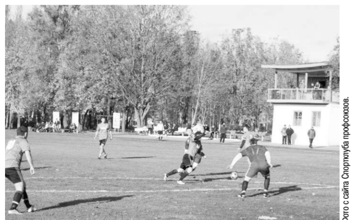
Болельщиков многих сёл и городов Воронежской области ждут интересные футбольные поединки.