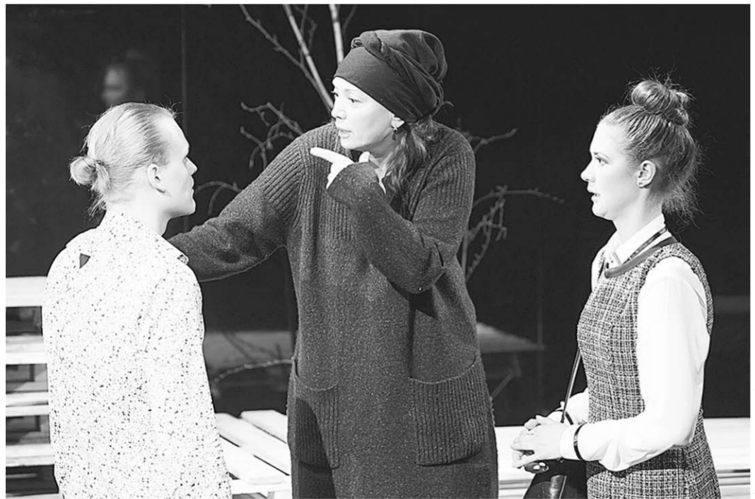
То, что говорит об этом мире Арина Аркадьевна, вряд ли понравится ханжам-политиканам.