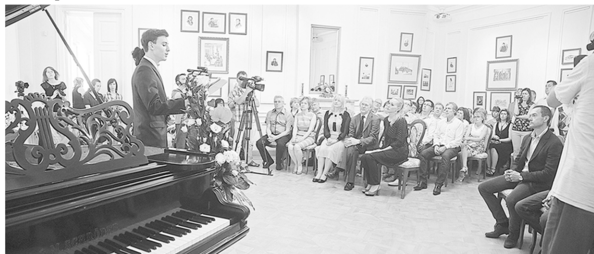
В Каминном зале собрались многие из тех, кто был причастен к созданию музея и его недавней реконструкции.

Культура | Музей-усадьба Дмитрия Веневитинова в Новожиловском Рамонского района отметил своё двадцатилетие