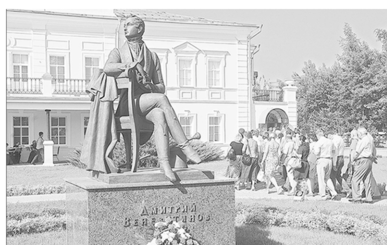
Праздник начался у памятника поэту.