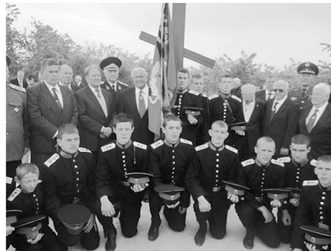
Воронежские кадеты и официальные гости на открытии памятника в Сербии.

Воспитанники Воронежского Михайловского кадетского корпуса настроены патриотично и гордятся тем, что их учебное заведение заслужило право посетить Сербию и Крым