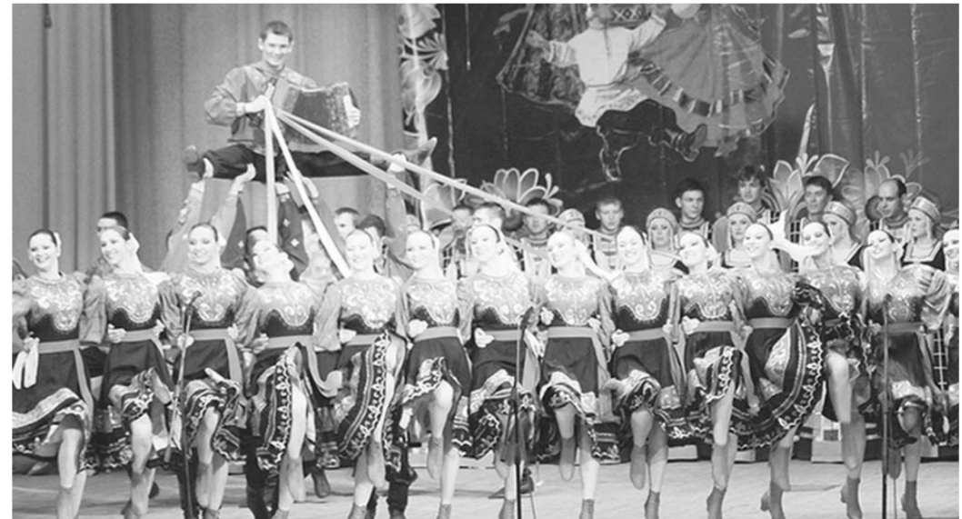
Выступают «Весенние зори».

Странные идеи порой рождаются у высоких руководителей регионального уровня. Или они не ведают, что делают и говорят? Нет, факты свидетельствуют о другом: очень даже ведают, если речь идёт о личных интересах и собственном кармане. И тут брать щенки борзых малавно будет. Здесь люди серые, они круче берут!