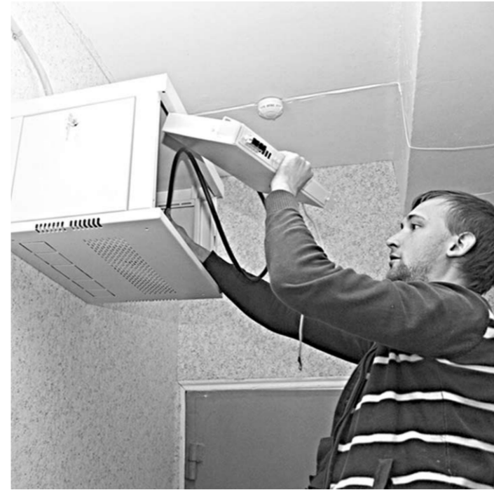
Идёт установка ПАКов.

Программно-аппаратные комплексы – сокращенно ПАК – включают в себя две видеокамеры, ноутбук или компьютер, комплект кабелей, внутренний жесткий диск. При установке ПАКов «Ростелеком» задействует собственную сетевую инфраструктуру. Все пункты проведения экзаменов и региональные центры обработки информации будут находиться под технической поддержкой наших специалистов. Мы готовы к исполнению государственного контракта на оказание услуг по организации видеонаблюдения при проведении ЕГЭ на территории Воронежской