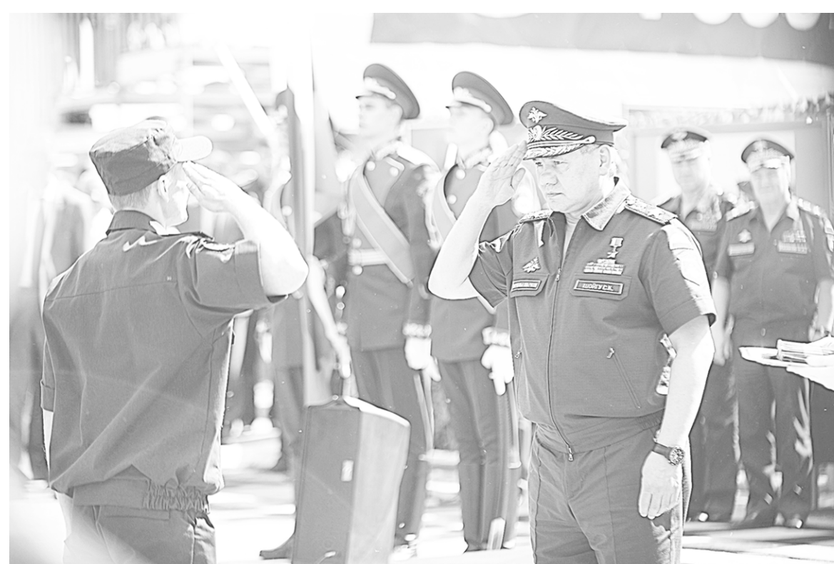
Министру обороны России генерал армии Сергей Шойгу вручил лейтенантские погоны молодым офицерам.

Не успев до конца договориться с офицером, как прибыли министр обороны Сергей Шойгу, глава региона Алексей Гордеев и другие сопровождающие лица. Приняв доклад начальника авиации ВВС России, глава военного ведомства