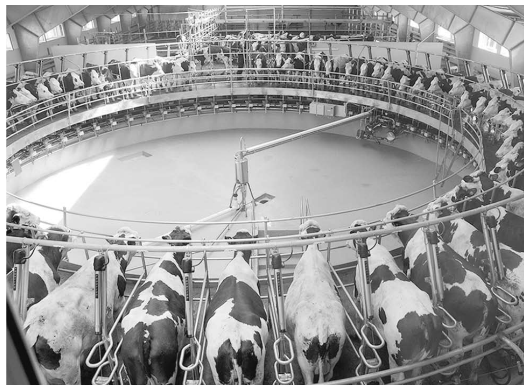
В новом комплексе – новейшие технологии.