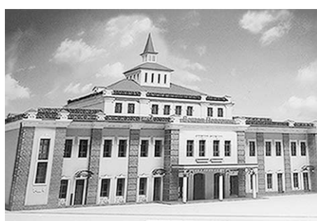
Вот таким видят архитекторы вокзал «Поворино-1».

На станции Поворино близится к завершению капитальная реконструкция железнодорожного вокзала. Один из подрядчиков – компания «Воронежстройинжиниринг» – обещает этот крупный объект завершить ко Дню железнодорожника.