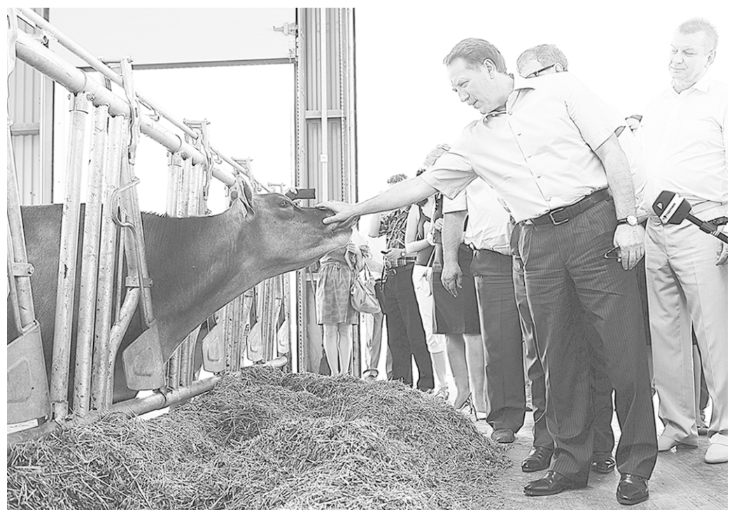
Алексей Гордеев осмотрел в хозяйстве «Новомарковское» новую молочнотоварную ферму.