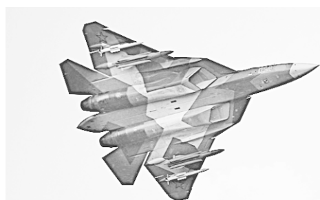
Министру обороны и главе региона продемонстрировали пару новейших российских истребителей Т-50.

В целом по стране сдавать ЕГЭ будут около 750 тысяч человек. Для них открыто около шести тысяч пунктов проведения экзамена, что почти на 20 процентов меньше, чем в прошлом году. Всего по стране установят около 35 тысяч камер.