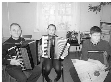
Исполнительское мастерство оттачивается на уроках.

Воспитанники Поворинской школы искусств победили в музыкальном межрегиональном конкурсе «Путь к мастерству» в Борисоглебске. Самыми успешными жюри признало выступление пианистов и гитаристов из младшей возрастной группы.