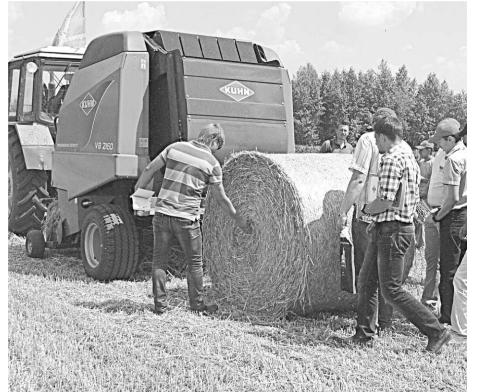
На Дне поля KUNN в 2013 году пресс-подборщики VB 2160 вызвали огромный интерес аграриев. Теперь они есть во многих хозяйствах области.

Например, косилки KUNN в зависимости от модели имеют ширину захвата от 1,6 метра до 9 метров. Широкое применение получили навесные косилки. Всё большей популярностью у аграриев пользуются и прицепные косилки KUNN. Они могут работать со скоростью до 22 километров в час, при этом, каким бы ни было неровным поле, и как бы ни прыгал – возможно – трактор, сама косилка буквально копирует рельеф почвы и обеспечивает минимальную высоту среза. Растёт спрос на косилки-плющилки. Плющильные аппараты на них бывают двух типов – пальцевый для злаковых культур и вальцевый для культур бобовых. Очень интересна и новинка – прицепная косилка FC 3160 TCD с центральным расположением дрыла и универсальным плющильным аппаратом. Его можно косить травы как справа, так и слева от трактора. Вообще кормозаготовительные машины KUNN очень технологичны, очень удобны в обслуживании, а узлы, подверженные износу, при необходимости меняются легко и быстро.