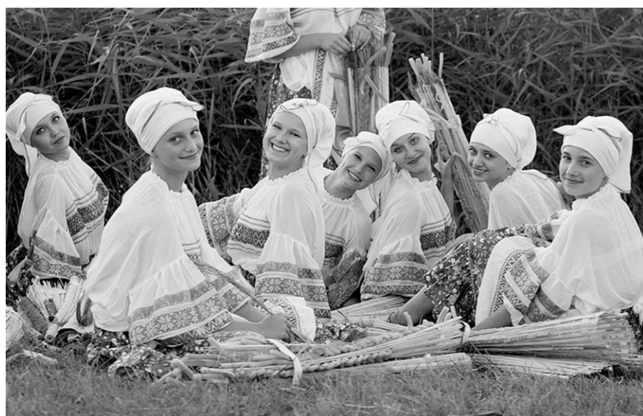
Участницы народного ансамбля «Каскад».

Трансляция самобытных традиций региона будет осуществляться на зональном этапе Всероссийского фестиваля народного творчества «Вместе мы – Россия» в Твери в сентябре. Во всех районах мы проведем конкурсы профессионального мастерства, областные семинары, мастер-классы, являющиеся основой