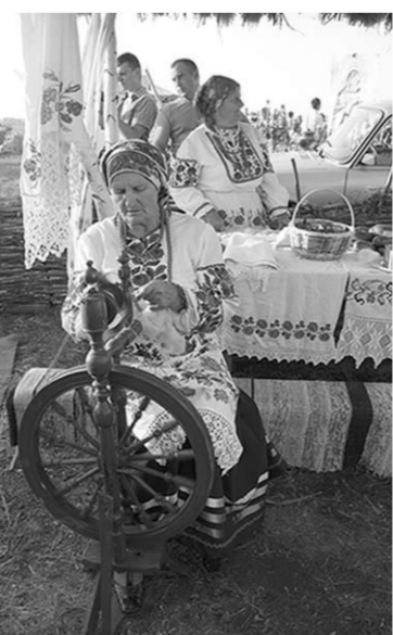
Хранительница традиций из Калачевского района.