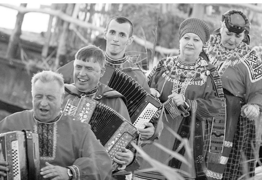
Фольклорный ансамбль «Воля» из Воробьевки – постоянный участник фестиваля «Русь песенная, Русь мастеровая».