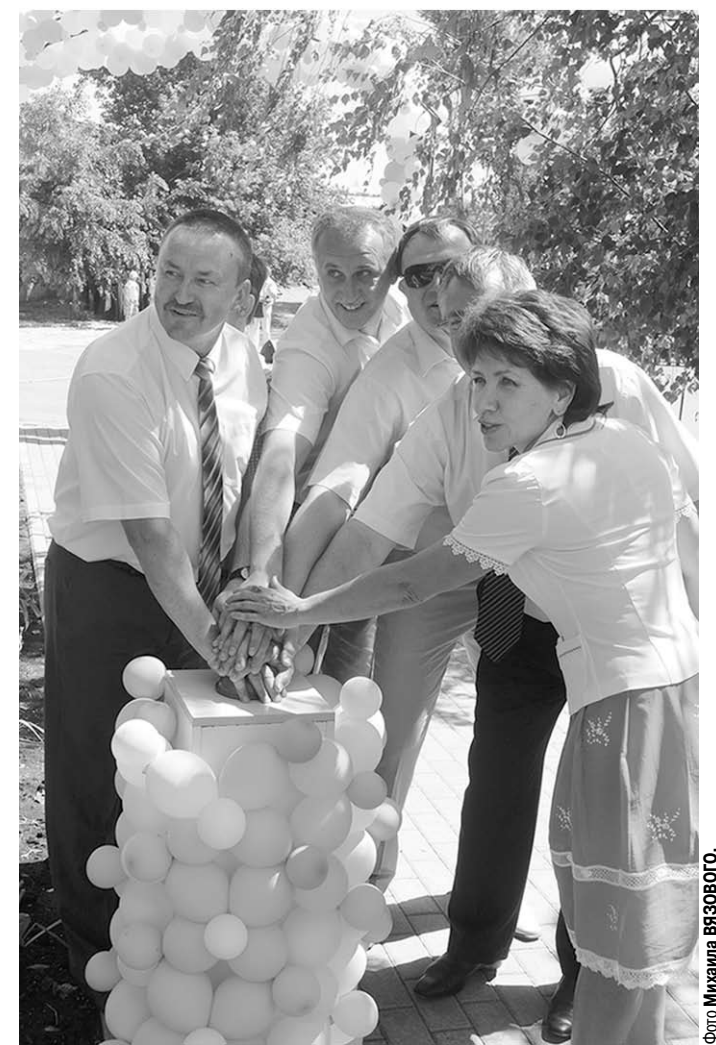
Торжественный пуск сельского водовода.

...Считанные минуты – и закипели самовары, над Васильевкой поплыл запах ароматного чая, на столах появились пирожки, ватрушки, пышки, булочки, зазвенели песни, кто-то пустился в пляс: вот она, наша простая и искренняя сельская радость!