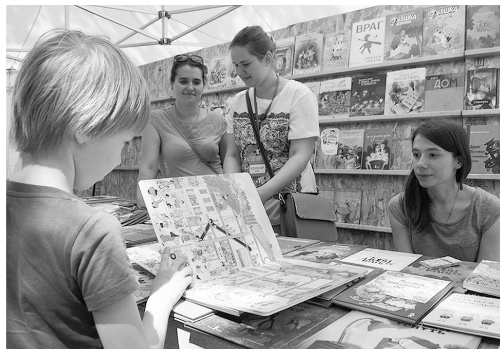
Книжная ярмарка удивляет обилием детской литературы.

Если в предыдущие годы на книжных ярмарках были представлены в основном издательства двух столиц – Москвы и Санкт-Петербурга, то в нынешний география заметно расширилась