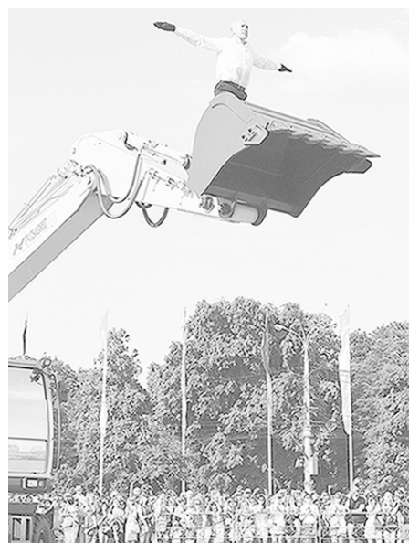
Иногда и экскаватор помогает взлететь.

Причём небеса почувствовали: происходит что-то важное. И жара стала спадать где-то без десяти шесть вечера. Заранее обустроенные сиденья места к тому моменту были уже заняты, заполнились зрители и окрестности вокруг огороженного пространства, на котором должно было пройти представление. Уличные театры — что-то совсем новое для Воронежа. В программе Четвёртого Платоновского фестиваля искусств — сразу несколько представлений коллективов из Франции, Нидерландов, Германии, Польши, России. Причем их шоу можно посмотреть совершенно бесплатно. Первая из уличных акций